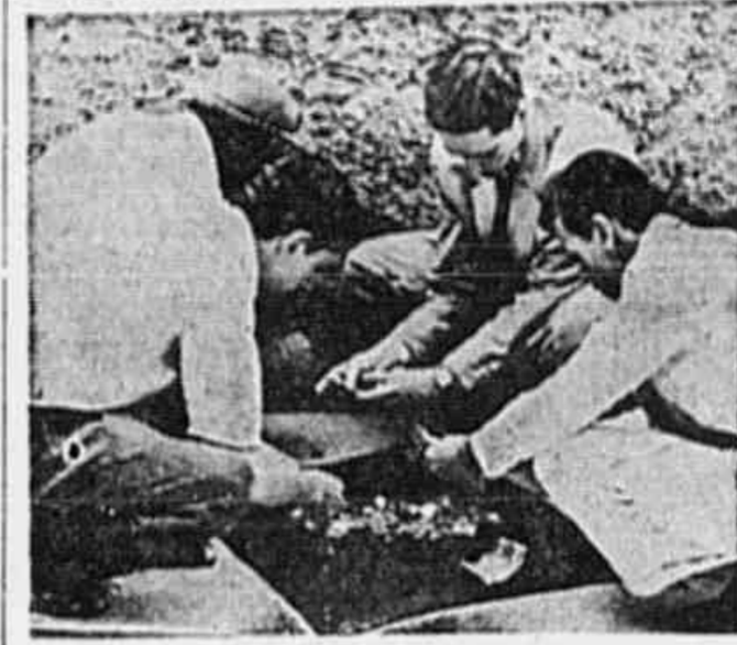
O povo contribui para a sua imprensa

Na próxima terça-feira, dia 17, às 20 horas, o senador Luiz Carlos Prestes realizará no auditório da ABI, uma palestra sobre o tema "Liberdade de Imprensa, base da Democracia". A entrada far-se-á livre e voluntariamente, mediante convite e podem ser encontrados nesta redação e na Livraria José Olympio, na rua do Duvidor, 118.