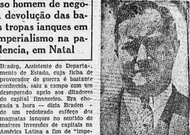
Braden, o diplomata-atômico derrotado por Peron, que continua dando as cartas em Washington.

Assim que correu a notícia da escolha, pela U. D. N., do nome do Sr. José Américo de Almeida para candidato ao cargo de Vice-Presidente da República, em oposição à can-