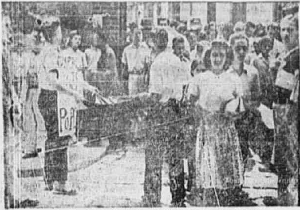
A porta da fábrica, operários contribuem para a imprensa popular