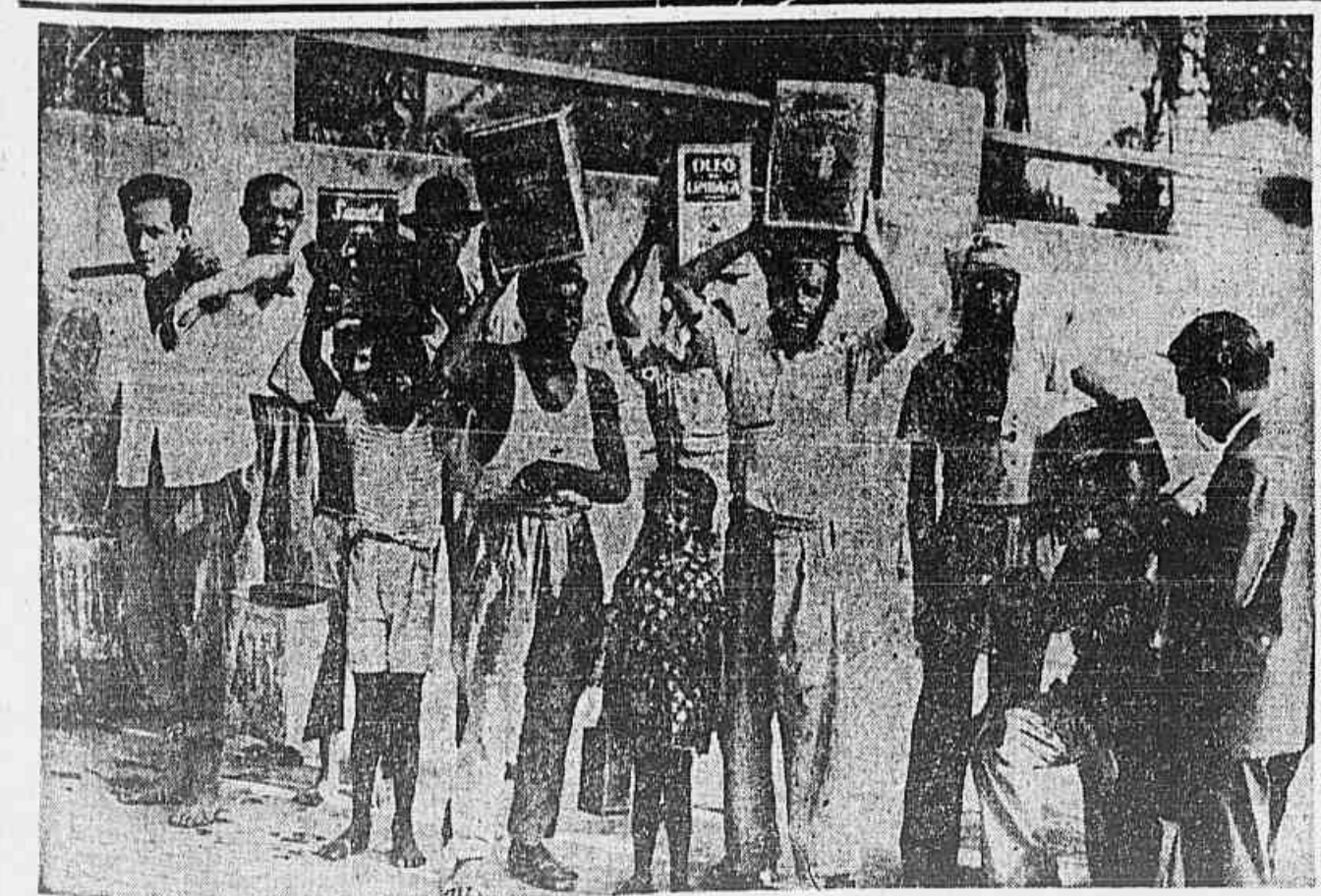
ALÉM DA FALTA DE LEITE, DE PAO, DE VERDURAS, DE CARNE, DE ROUPA E CALÇADOS BARATOS, ALÉM DA CARESTIA QUE SE AGRAVA, falta a água e as filas crescem em torno das raríssimas lojas ou torneiras públicas que jorram pelos morros, pelas ruas do subúrbio ou de um canto escuro. Não basta o balde cheio no caminhão, no porto, na fábrica, na construção civil; o repouso nesta hora de crise é sonho, e a realidade é a fadiga de sempre do trabalho para a fã e da fã para o trabalho.

O imperialismo arranca a máscara, ao tratar da questão do "custo histórico", debatida em nossa Constituinte