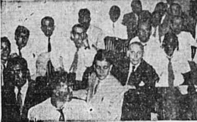
Flagrante da reunião da 7.ª Comissão, quando falava um congressista

Na tarde de ontem nossa reportagem teve oportunidade de acompanhar os trabalhos em todas as Comissões, verificando o mesmo ambiente de harmonia, ordem e satisfação por parte dos congressistas com a forma pela qual haviam sido organizados os trabalhos, com a atuação dos presidentes das mesas e dos assistentes técnicos do Ministério. Segundo spramos, as Conclusões das Teses apresentadas sobre os vinte pontos do Tamarit deverão estar concluídas e aprovadas pelas plenárias das Comissões até à noite de amanhã, a fim de que possam ser apresentadas ao grande plenário, que se reunirá segunda-feira à noite para início