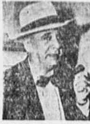
ESTE E O SUBSTITUTO DE SIDNEY HILLMAN...

Consta do mesmo o reconhecimento legal do Partido Comunista do Paraguai - Convocação da Constituinte