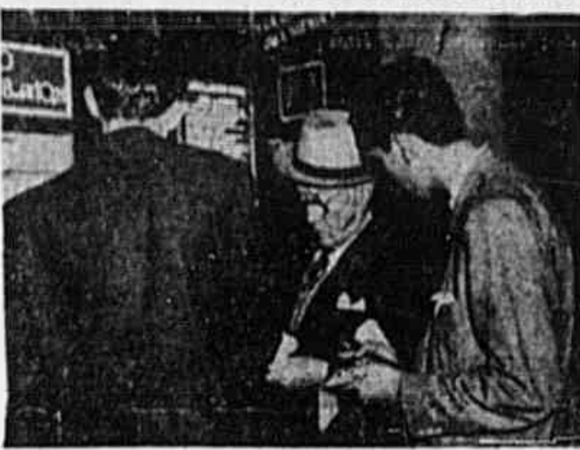
Alguns populares, quando faziam a nossa reportagem