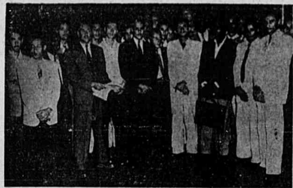
Os ferroviários que vieram à TRIBUNA POPULAR

ANO II ☆ N.º 303 ☆ SABADO, 18 DE MAIO DE 1946