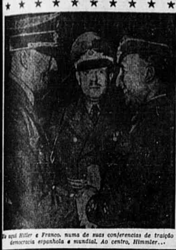
Aqui Hitler e Franco, numa de suas conferências de traição à democracia espanhola e mundial. Ao centro, Himmler...

Na Cidade Heroica, Avulta o Odio ao Provocador "trabalhista" Negrão de Lima