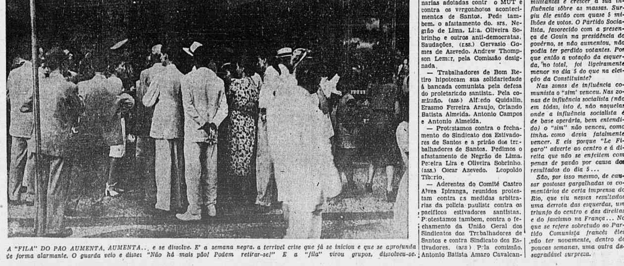
A "FLA" DO PAO AUMENTA, AUMENTA... e se dissolve. E a semana negra, a terrível crise que já se iniciou e que se aprofunda de forma alarmante. O guarda veto e disse: "Não há mais para! Podem retirar-se!" E a "FLA" virou grupos, dissolvido-se.