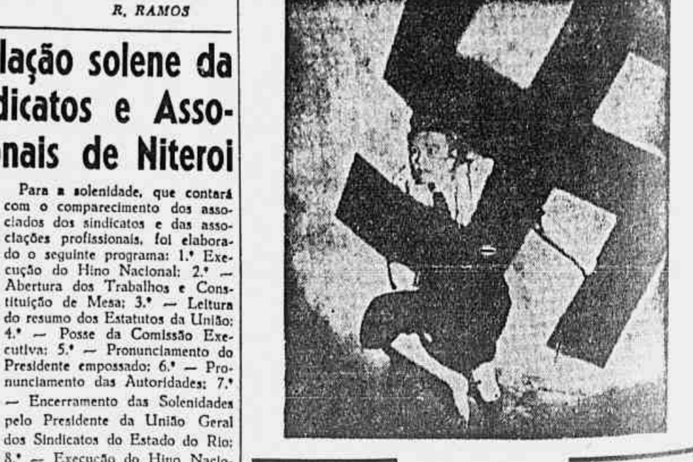
Escuras brancas... Mulheres alemãs submetidas ás mais degradantes práticas: examinadas, fichadas e selecionadas como máquinas reprodutoras da pretensa raça superior. Batismos pagdos, mercados de morte, esterilização e outros segredos do regime nazista, revelados sensacionalmente em ESCRAVAS DE HITLER (impróprio para crianças até 13 anos), o filme que estreará amanhã exclusivamente no Rio.