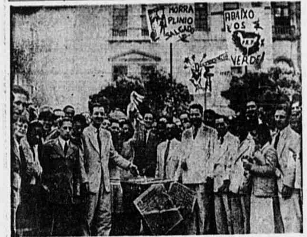
MANIFESTANDO SEU REPODIO AO FASCISMO, os estudantes desta capital, a convite do Conselho Estudantil, realizaram, ontem, o enterro do nazifasc-integralismo, simbolizado nas bandeiras de Hitler, Mussolini e Pinoco. O ato verificou-se em frente ao Cine Maricó, com a participação dos transeuntes. Foi desta maneira que os jovens prestaram sua homenagem à memória de nossos valentes pracinhas sepultados em Pitóia.

Tribuna POPULAR ANO II ☆ N.º 298 ☆ DOMINGO, 12 DE MAIO DE 1948