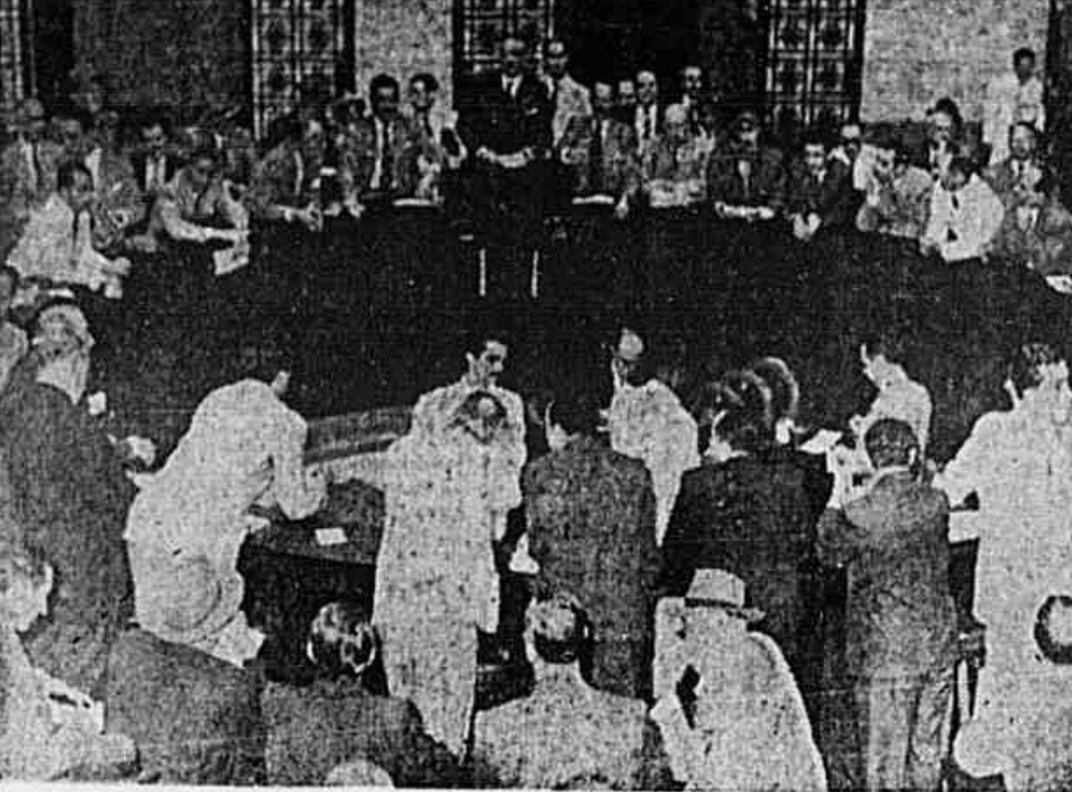
Formados em dois círculos concêntricos, estes cor-retores gritam ensurdecedoramente durante meia hora, apreendendo ações e títulos da Dívida Pública

Uma sucursal do inferno capitalista — Uma gritaria que faria inveja a todo o hospício nacional de alienados — Historia das "Obrigaçãoes de Guerra" — Jogatina com os títulos da Dívida Pública