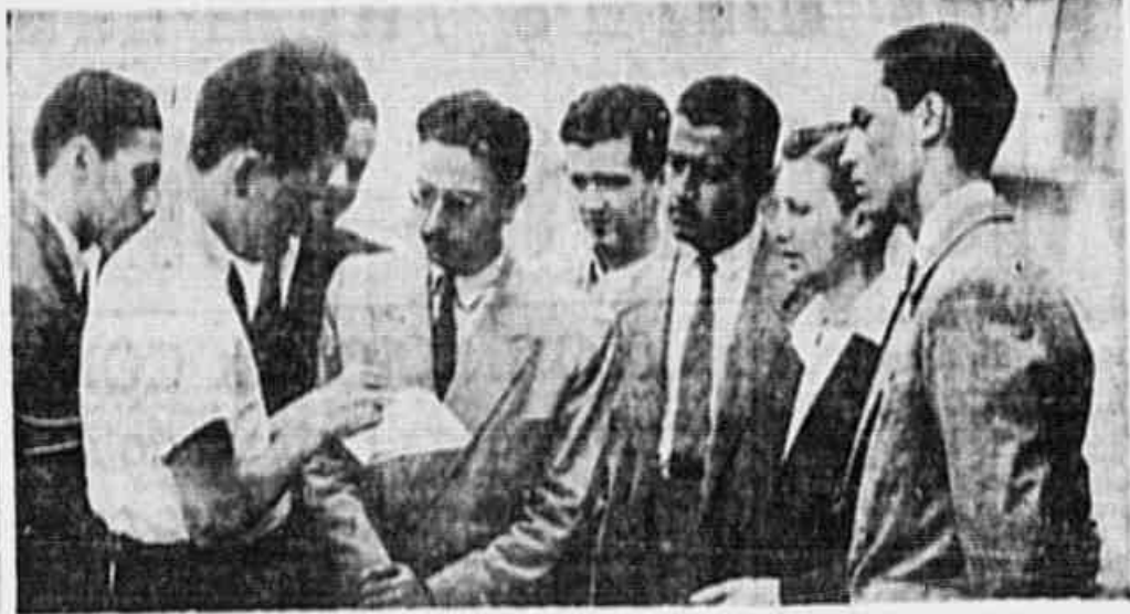
OS CANDIDATOS A ESCOLA DE ENGENHARIA, que apareceram na gravura, foram, nos últimos exames, habilitados. Por nosso intermédio optaram para o diretor daquela Escola e para o reitor da Universidade, no sentido de serem-lhes concedida nova oportunidade, isto é, novas provas, uma vez que ainda não foram preenchidas as vagas existentes. Os estudantes nada mais pleiteiam, com isto, senão o que obtiveram os seus colegas das escolas de Belas Artes, Arquitetura e Medicina, Admetem, o Conselho Universitário é, em princípio, favorável a essa justa reivindicação. Que os diretores da Escola de Engenharia se lembrem de que o Brasil necessita de técnicos para a sua futura indústria e facilitem o ingresso desses moços na vida universitária.

NA CASA DO OPERÁRIO, O CAFÉ PREDILETO E O PREFERIDO... TAMBEM, NA CASA DO PORTUARIO O CAFÉ PREDILETO E O ESCOLHIDO... CAFÉ PREDILETO - AV. MARECHAL FLORIANO, 133