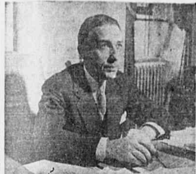
O agente imperialista Berle Jr. não diminui a sua insolência mesmo afastado do Brasil, o qual ele continua a ofender com sugestões infelizes e seus conselhos de "tia Paula", que, na realidade, demonstram a sua incapacidade diplomática e os odiosos sentimentos da classe a que serve e pertence

Ousa o desastrado diplomata americano ditar normas aos brasileiros. Conselho paternalista ao nosso governo, aos "homens de negocio" e aos "partidos da opposição"