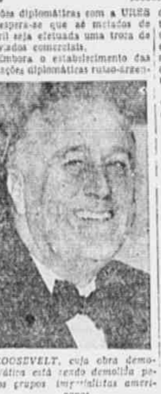
ROOSEVELT, cuja obra demagógica está sendo demolida pelos grupos imperialistas americanos