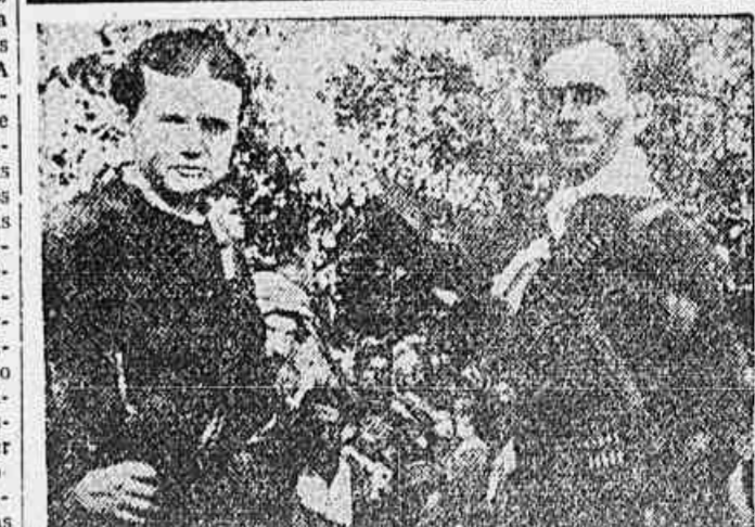
NO MOMENTO EM QUE A GREGIA é estirada de novo ao seus opressores contumazes, à "tropas" do rei estrangeiro e desmoralizado Jorge II, há duas vezes de há muito pelo seu povo — no momento em que as tropas do imperialismo da City forçam o glorioso povo do Egito a submeter-se aos seus inimigos de sempre, aos que o haviam tratado aliando-se ao nazismo, nada mais justo do que evocar o sacrifício e a bravura dos seus gloriosos guerreiros, cujas vitórias contra os invasores hitleristas o invasor Scaife roubou para os seus amigos imperialistas.

Inteira solidariedade do povo brasileiro na luta contra o imperialismo — Os trabalhadores já-mais acreditarão nas intrigas da reação — Numerosas mensagens de apoio chegam de todo o Brasil ao Senador do Povo