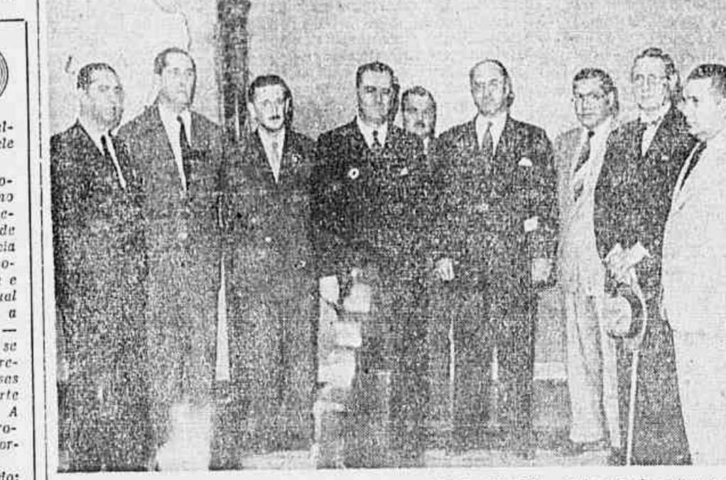
VITORIOSOS OS EMPREGADOS DO PORTO DE SANTOS — Foi assinado ontem o aumento dos salários...