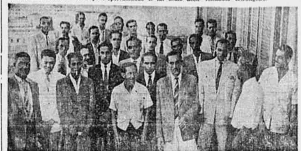
Metalúrgicos, que apoiam com entusiasmo o Congresso Sindical, estiveram, ontem, a nossa redação. O clichê fixa um aspecto da reunião.

Nós, trabalhadores, jamais admitiremos que os senadores da República, todos honrados e quem se deve respeitar, sejam humilhados vergonhosamente, por certos reacionários baratos, que são instrumentos do capital colonializador estrangeiro.