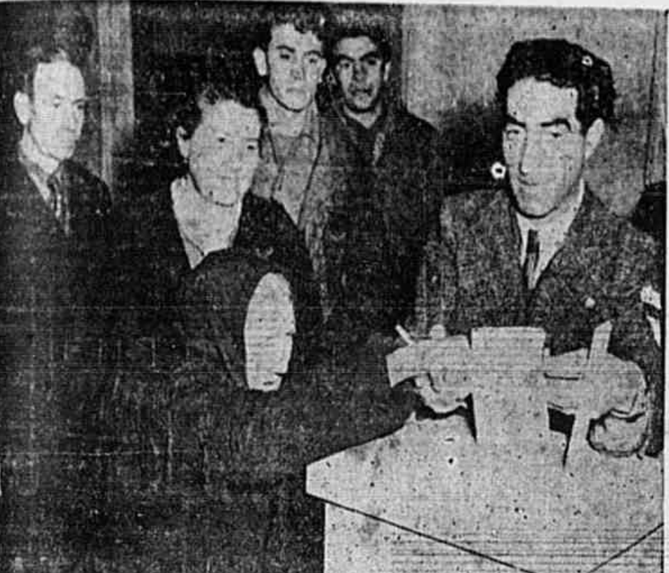
LIBERTO DO NAZISMO, o povo italiano vota a escolha dos dirigentes dos destinos da Itália. Na fotografia acima temos uma eleitora de 82 anos de idade, cega, exercendo, com o auxílio de um funcionário, o direito de voto.