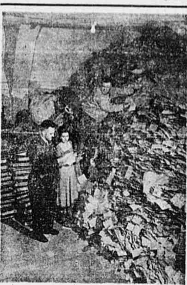
AS TROPAS NORTE-AMERICANAS ENCONTRARAM EM MUNICH um arquivo contendo milhares de nomes e endereços de membros do Partido Nazista...

Deve ser publico o processo das mulheres anti-fascistas espanholas TELEGRAMA DA DEPUTADA VAILLANT COUTURIER A LUIZ CARLOS PRESTES