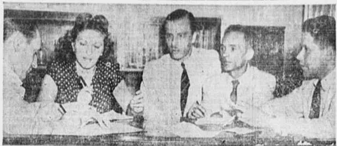
Comitê diretora da Campanha de Alfabetização dos Comitês Populares