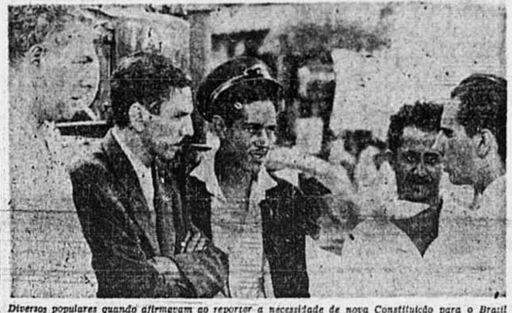
Diversos populares quando afirmavam ao repórter a necessidade de nova Constituição para o Brasil