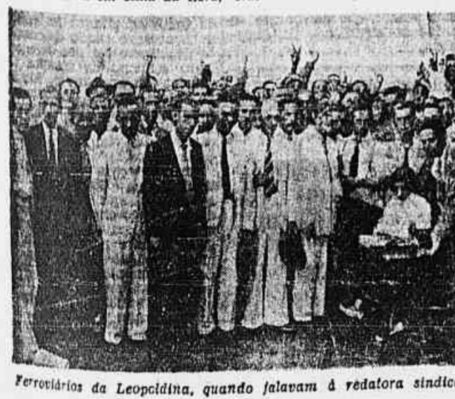
Ferrovários da Leopoldina, quando falavam á redatora sindical

Com alguns dias de antecedência já fora marcado para ontem, ás 12 horas, no Conselho Regional do Trabalho, o julgamento do dissidio coletivo dos ferroviários da Leopoldina contra a qualificação empregadora.