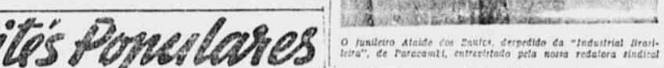
O Sindicato Alçado dos Zepicos, despedido da "Industrial Brasileira", de Paracambi, entretido pela nossa redação sindical.