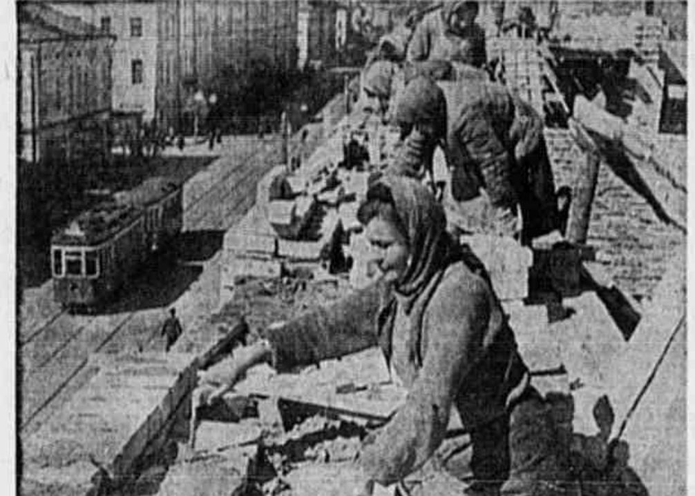
CRESCER DIA A DIA o ritmo da reconstrução das áreas da União Soviética devastadas pelos alemães. No clichê ao alto, aparecem grupos de cidadãos soviéticos trabalhando como pedreiros no levantamento de edifícios de uma rua de Stalingrado. Note-se que o lado direito da rua já está completamente reconstruído.

ANO II * N. 210 * Av. Apórcio Borges 207-13. * Sexta-feira, 25 de Janeiro de 48