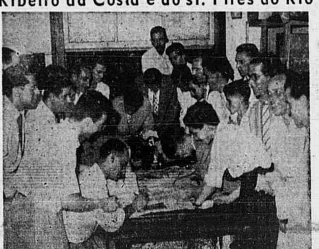
No Sindicato, à noite, os bancários trabalham na reivindicação dos seus direitos e a greve justa prossegue

Quinhentos funcionários do Banco do Brasil aderiram ao movimento ★ Solidários, até agora os bancários de São Paulo, Santos, Porto Alegre, Belo Horizonte, Recife, Curitiba, Belem, Vitoria, S. Luiz, Fortaleza, Niterói, Campos, Barra do Pirai, Rio Bonito, Itaperuna, Petrópolis, Três Rios, Cataguazes e Caratinga ★ Provocada pela intransigencia de banqueiros gananciosos, a greve só terminará com a vitória completa