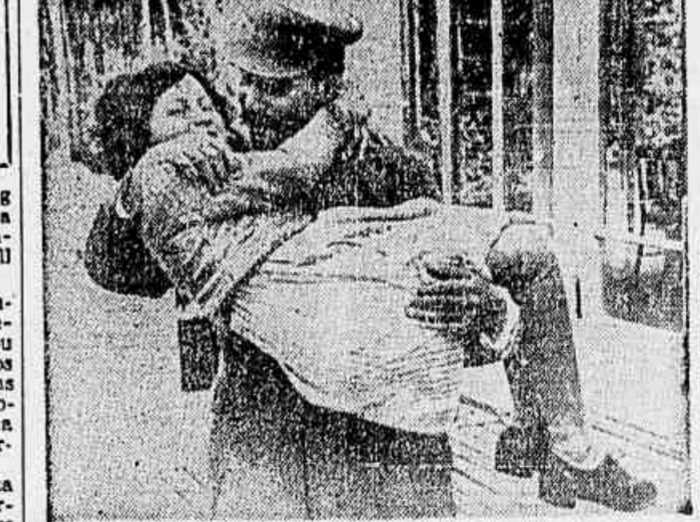
NOTICIUO UMA AGENCIA TELEGRAFICA norte-americana que o presente de aniversário do generalissimo Stalin, o guia geral dos povos soviéticos, foi o nascimento de uma netinha. Como se sabe, Stalin tem dois filhos: Vassili, coronel das forças aéreas do Exército Vermelho e heroi da grande guerra patriótica da URSS, e Svetlana, ao que dizem os jornais ainda estudante da Universidade de Moscou.