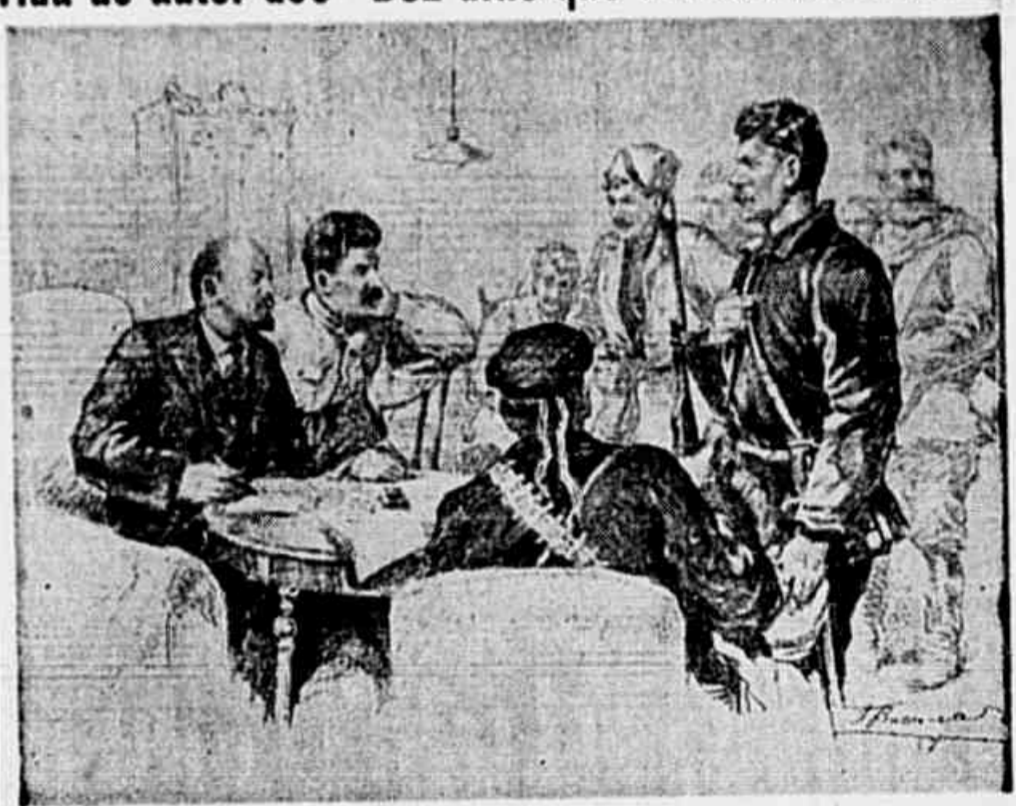
Lenta e Stalin entre guardas vermelhos, no Inst Ituto Smalny, Q. G. da Revolução de Outubro.