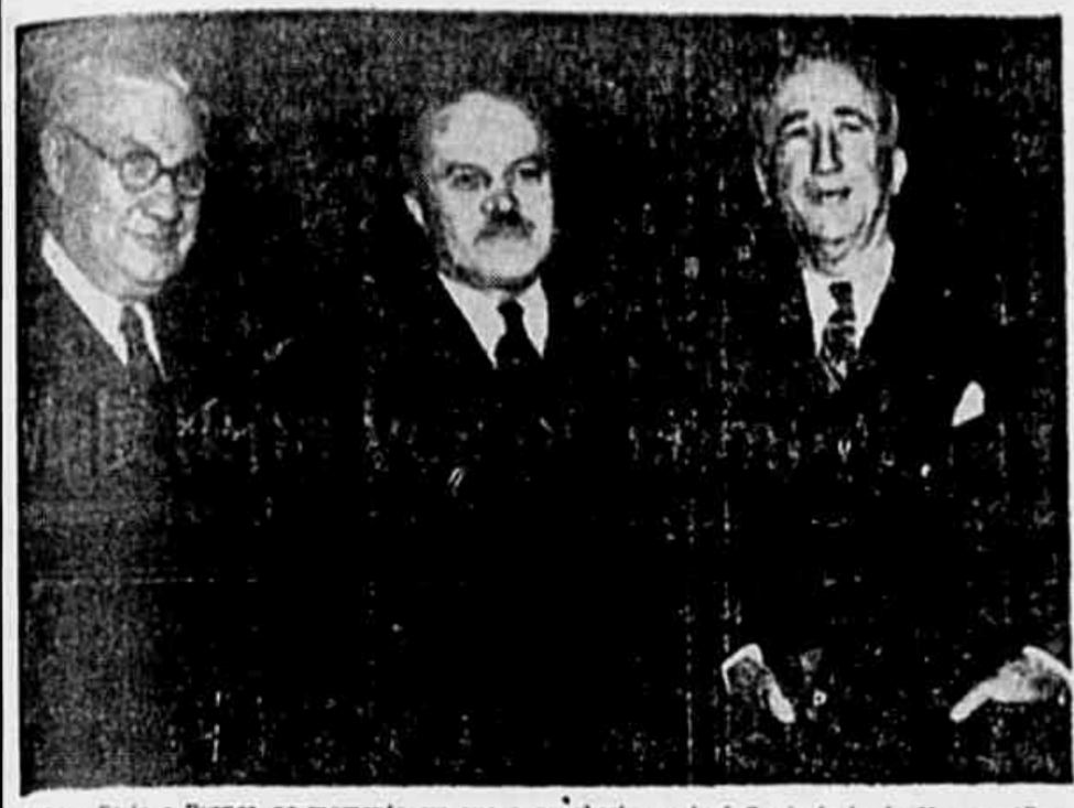
Walter, Brito e Byrnes, no momento em que se abriu a atual Conferência de Moscou.

Fixadas em Moscou as condições para os tratados de paz com a Italia, Rumania, Bulgaria, Hungria e Finlândia