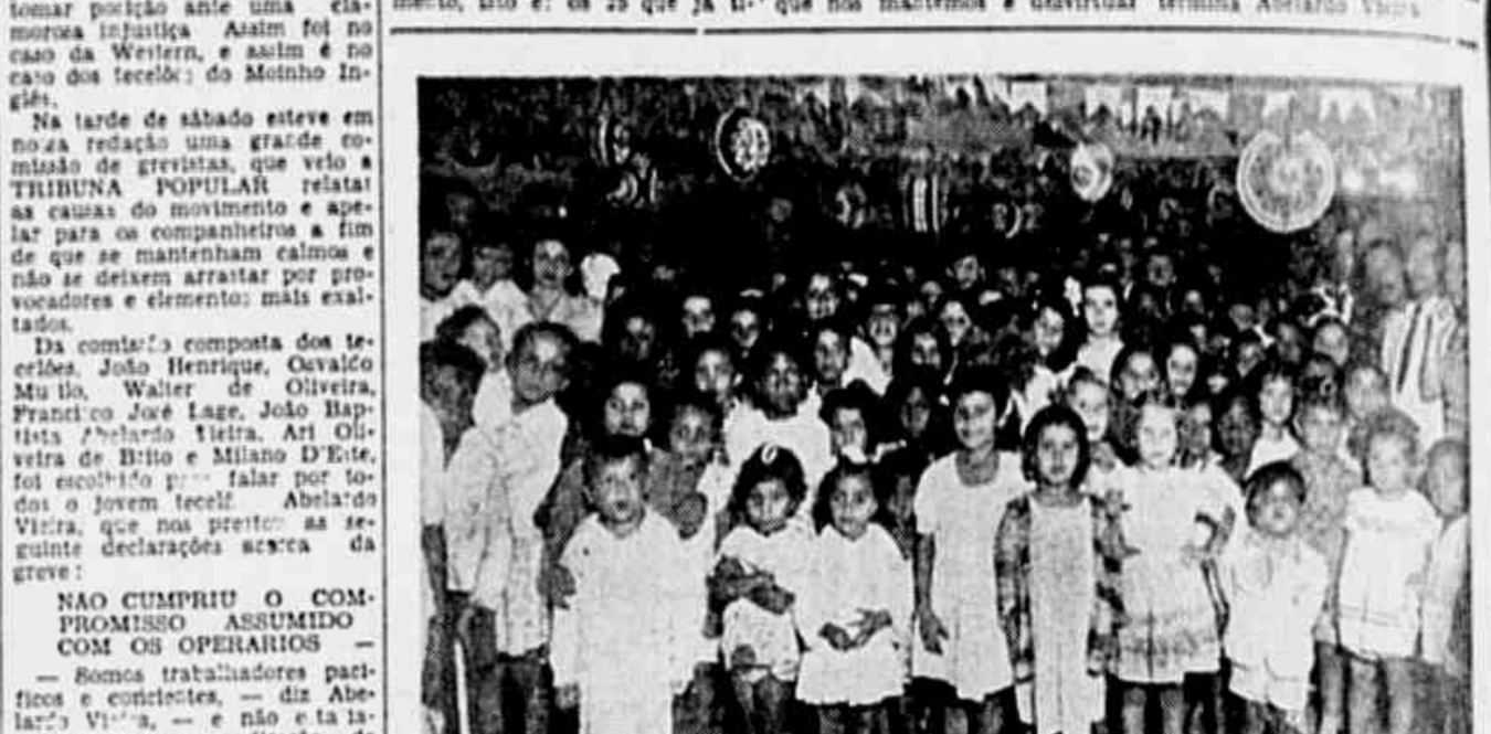
CRIANÇAS DE JACAREPAGUA por ocasião do festivo Natal organizado pelo Comitê Democrático Progressista daquele subúrbio. (Texto na quarta página)