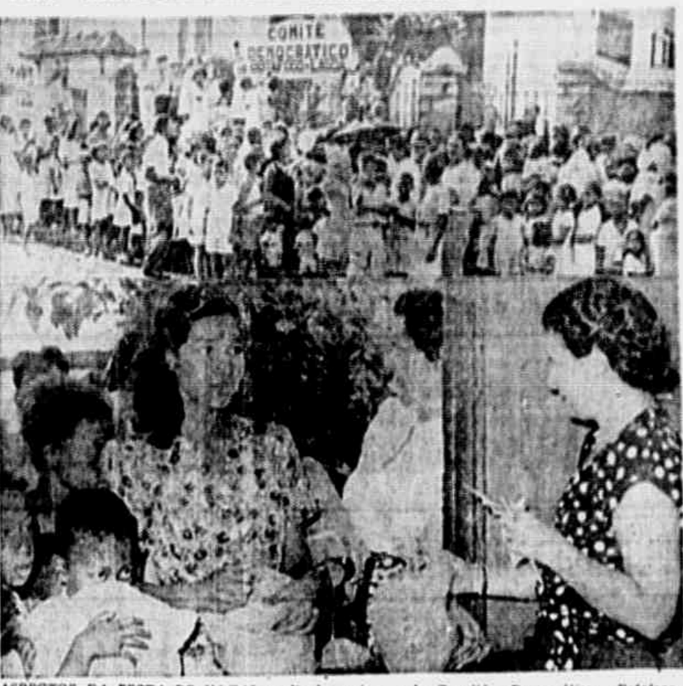
ASPECTOS DA FESTA DE NATAL realizada, ontem, pelo Comitê Democrático Botafogo-Lagoa. Ao alto: crianças da brinquedoteca recebiam seus presentes. Em baixo: uma jovem do bairro ao receber a sua lembrança quando.

toria. Contamos com a boa vontade do D.N.T., e esperamos que os empregadores saibam compreender as nossas necessidades, procurando com igual boa vontade dar-nos aquilo a que temos direito.