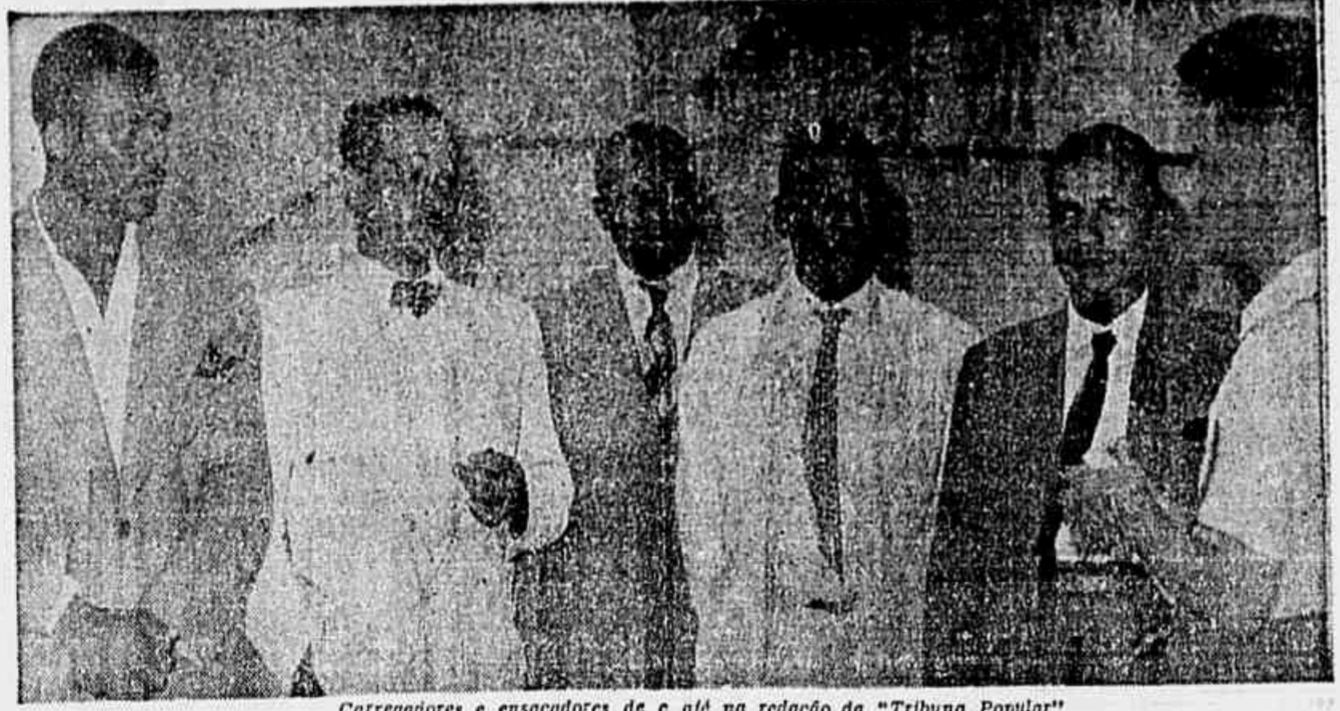
Carregadores e ensacadores de café na redação da "Tribuna Popular"

Os trabalhadores voltarão ao trabalho * Reunião no D.N.T. e o que os trabalhadores resolveram * Fala à "Tribuna Popular" uma Comissão de operarios