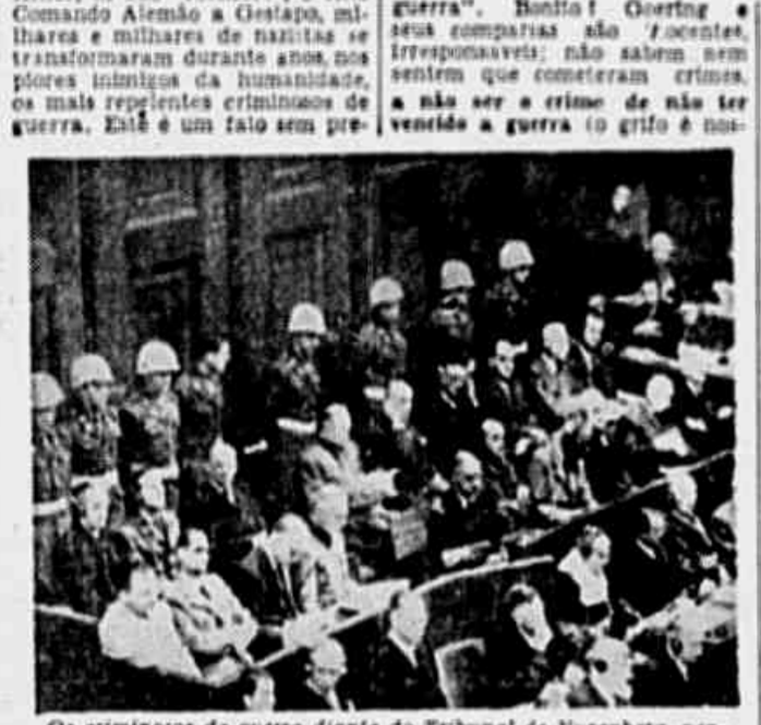
Os criminosos de guerra diante do Tribunal de Nuremberg, sendo- se entre outros, Hermann Goering...