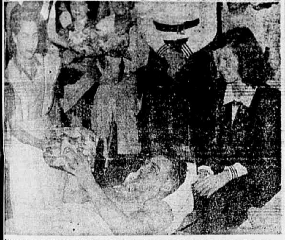
Os aspectos do Natal dos mutilados da FEB, realizado pelo Departamento Feminino da Liga...