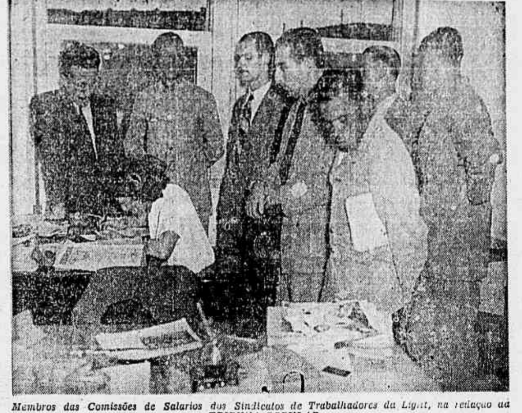
Membros das Comissões de Salarios dos Sindicatos de Trabalhadores da Light, na reunião da TRIBUNA POPULAR

O telefone do Comité Nacional do Partido Comunista do Brasil não cessou de tilintar o dia todo. É que o povo quer saber, com garantia, como se desenvolveram os trabalhos da apuração do pleito eleitoral e deseja conhecer os resultados, na certa, da contagem dos votos.