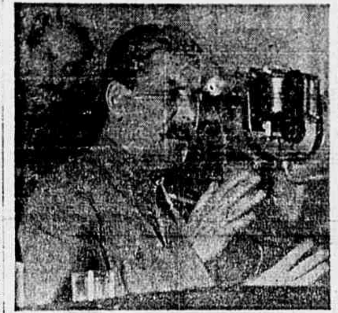
Stalin falando ao microfone (Sovjeto, para a "Tribuna Popular")

Um milhão de pessoas que conduziram cartazes e bandeiras e gritavam e cantavam.