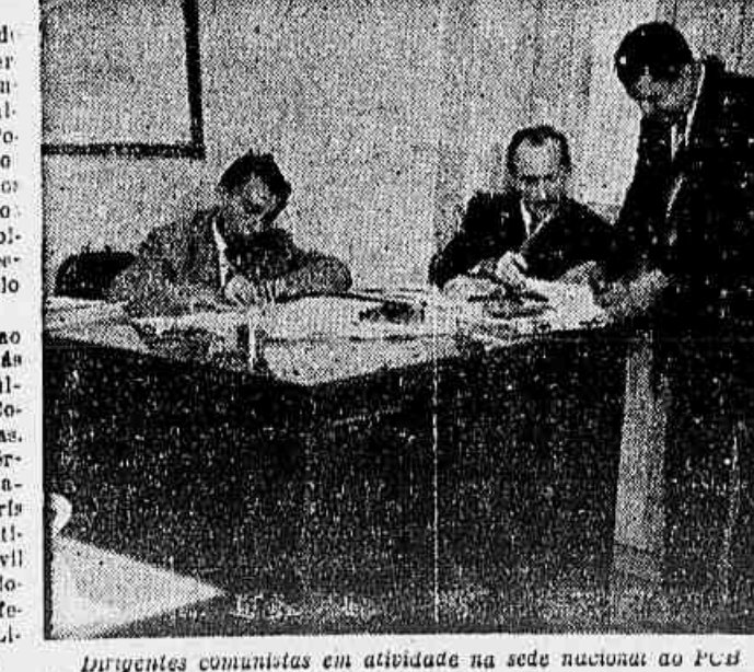
Dirigentes comunistas em atividade na sede nacional do PCB

Nada surpreendeu tanto ao povo como a notícia de que, às primeiras horas do dia 30 último, as sedes do Partido Comunista haviam sido fechadas, arroladas e forças do Exército se postavam, de metralhadora em punho, na Praça Paris e suas adjacências, como se estivessem em plena guerra civil ou voltassem aos ignominiosos dias de 35, quando foi fechada a Aliança Nacional Li-