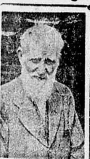
B. Shaw, o maior escritor de lingua inglesa, na sua ultima fotografia. Devido a idade e não se achando, por isso, com forças para imprimir no Partido Comunista Inglês, o grande satirico fez-se o maior acionista do "Daily Worker", órgão oficial da organização politica de conquista do proletariado e do povo britânico.

Os trabalhadores da Light estiveram na iminencia de ser arrastados à paralização dos serviços de transporte. A palavra de ordem do M.U.T. foi ouvida. O fantasma que nasceu da confusão. Inuteis quaisquer manobras para lançar os trabalhadores contra a ordem estabelecida. O proletariado como garantia da tranquilidade