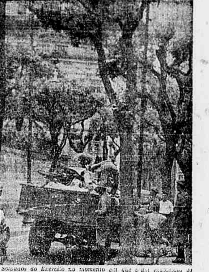
Soldados do Exército no momento de um ataque, em frente a um dos pontos de membros do Comitê Metropolitano do P. C. B. antes pela manhã.