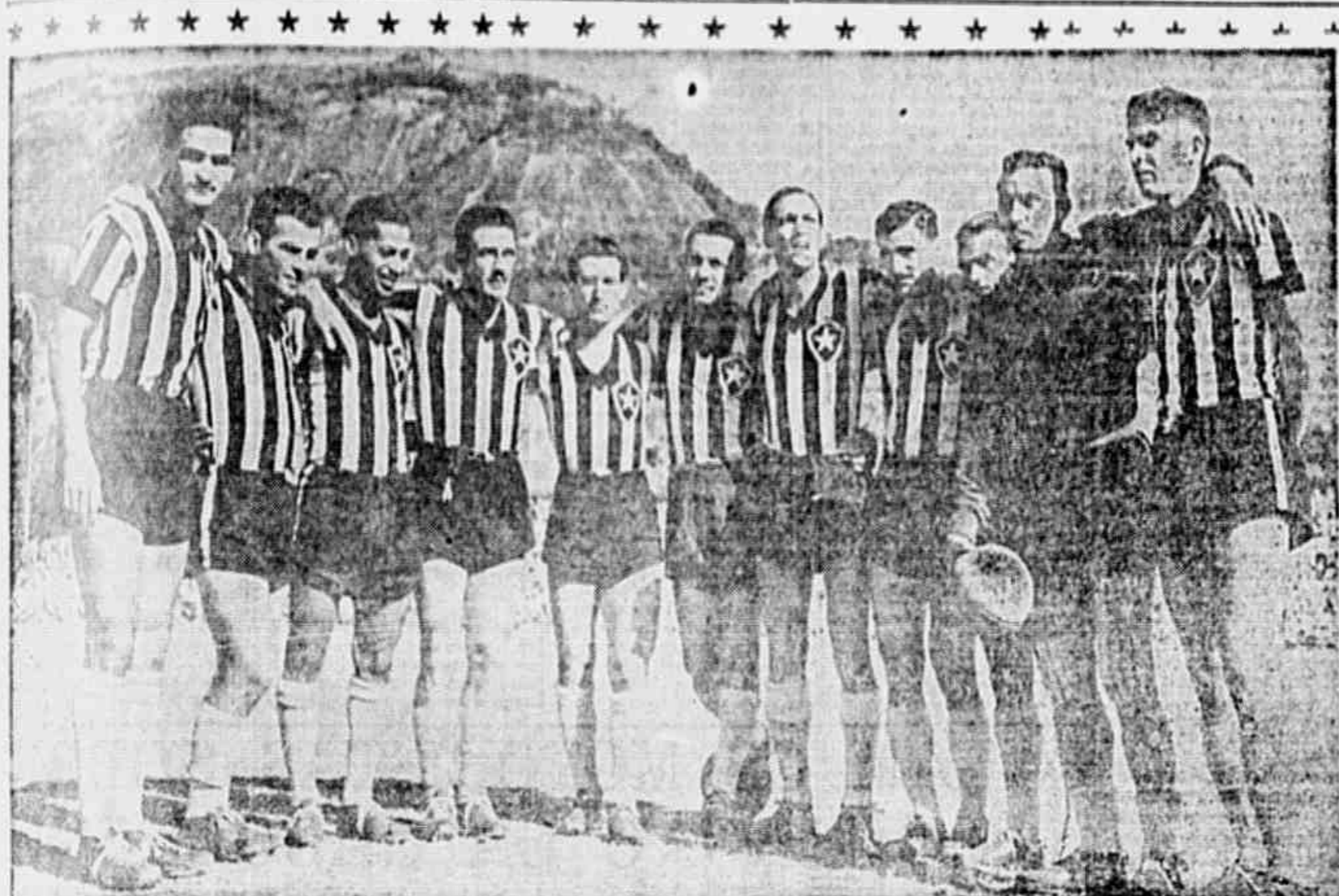
O time do Batatais, formado de jogadores de primeira linha.

Participou do ensaio de ontem, demonstrando estar em grande forma