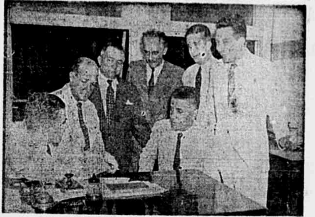
Membros da direção nacional do MUT palestram em nossa redação, com um dos diretores da TRIBUNA POPULAR.

De início perguntamos ao secretario-geral do P. C. B. como o Partido encara a nova situação. E ele nos respondeu: — O Partido, durante os ultimos meses, preveniu sistematicamente o proletariado e o povo contra os riscos de golpes armados e da guerra civil, lutando intransigentemente pela manutenção da ordem e da tranquilidade indispensáveis à marcha para a Democracia. Os ultimos acontecimentos mostram que o Partido tinha razão. E a conduta do povo diante desses acontecimentos, conduta de expectativa característica do elevado amadurecimento político a que chegou, mostra como o povo, de sua parte, reconhece a justa linha política de nosso Partido. O país correu o risco terrível do der-