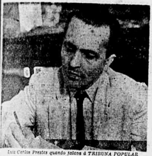
Luiz Carlos Prestes quando jaloneia a TRIBUNA POPULAR.

UMA ENTREVISTA COM O SECRETARIO GERAL DO P.C.B., NA SÉDE DO COMITÉ NACIONAL DO PARTIDO