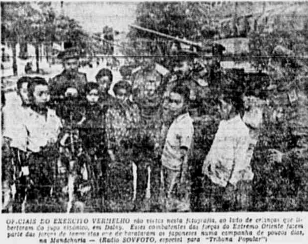
OFICIAIS DO EXERCITO VERMELHO são vistos nesta fotografia, ao lado de crianças que perderam os pais durante a guerra civil japonesa...

OLHO MÁGICO CONCLUSÃO DA 1ª PAG. elemento como um dos seus representantes. Tinha nessa ocasião 27 anos de idade.