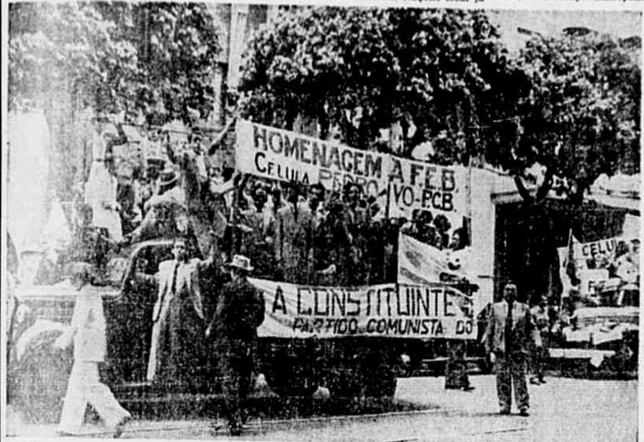
Desfilando em 150 caminhões e carros de patrole, os comunistas fizeram ostensiva homenagem aos bravos oficiais e soldados da FEB, que regressaram da Itália. No clichê acima estão em desses veículos, ostentando suas faixas e cartazes, os patriotas de ordem democrática, pela Constituinte e de assolação aos nossos heróicos expedicionários

Durante todo o percurso, até chegar ao palanque presidencial, a excita. foi alvo de numerosos e prolongados aplausos vibrantes da massa que se postara em longas filas, afim de assistir ao desfile dos vencedores de Montese.