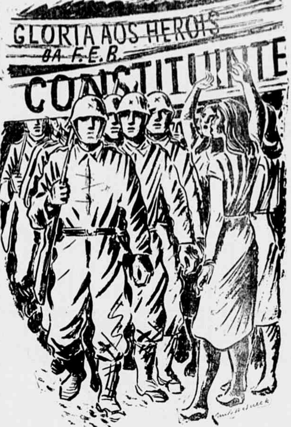
CONCLUE NA 2.ª PAG.