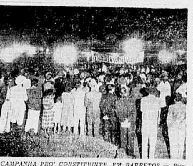
CAMPANHA PRO-CONSTITUINTE, EM BARRETOES — Promovido pelo Comitê Municipal do P.C.B. de Barretoes, Estado do Rio de Janeiro, realizou-se naquela cidade um grande comício popular que compareceu a manifestação pública para afirmar sua vontade, ocasião em que se deu o nome de Comitê Popular e do Partido Comunista do Brasil, repetido a todo instante a sua palavra de ordem: Constituinte! Após o comício foram enviadas telegramas ao Presidente da República, pedindo a convocação da Constituinte e liberdade sindical. O flagrante acima fixa um aspecto da entusiástica manifestação do povo local.

"Esses Comitês Populares terão de ser amplos de nenhuma outra partidarista e receberão seu selo a todos os stances demorados patriotas e progressistas que realmente lutem pela unidade nacional pela ordem e tranquilidade e suas reivindicações econômicas mais imediatas e por eleições livres e honestas. E evidente desde logo que tais organismos populares escultem como seus candidatos aos cargos eleitos os homens que lhes inspirem confiança, que lhes pareçam capazes de defender aquele programa e de participar ativamente da solução dos grandes e graves problemas nacionais da atualidade." (Luiz Carlos Prestes, discurso de dia 23 de maio)