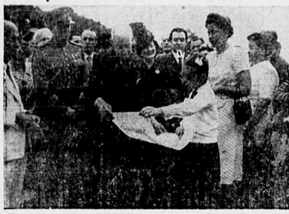
Flagrante da entrega da mensagem das crianças mexicanas por uma das alunas da "Escola México", na cerimônia de domingo último