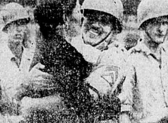
Ao alto, um sargento da FEB abraça, cheio de alegria, pessoa de sua família. Em baixo, um detalhe do desfile dos bravos oficiais e soldados expedicionários