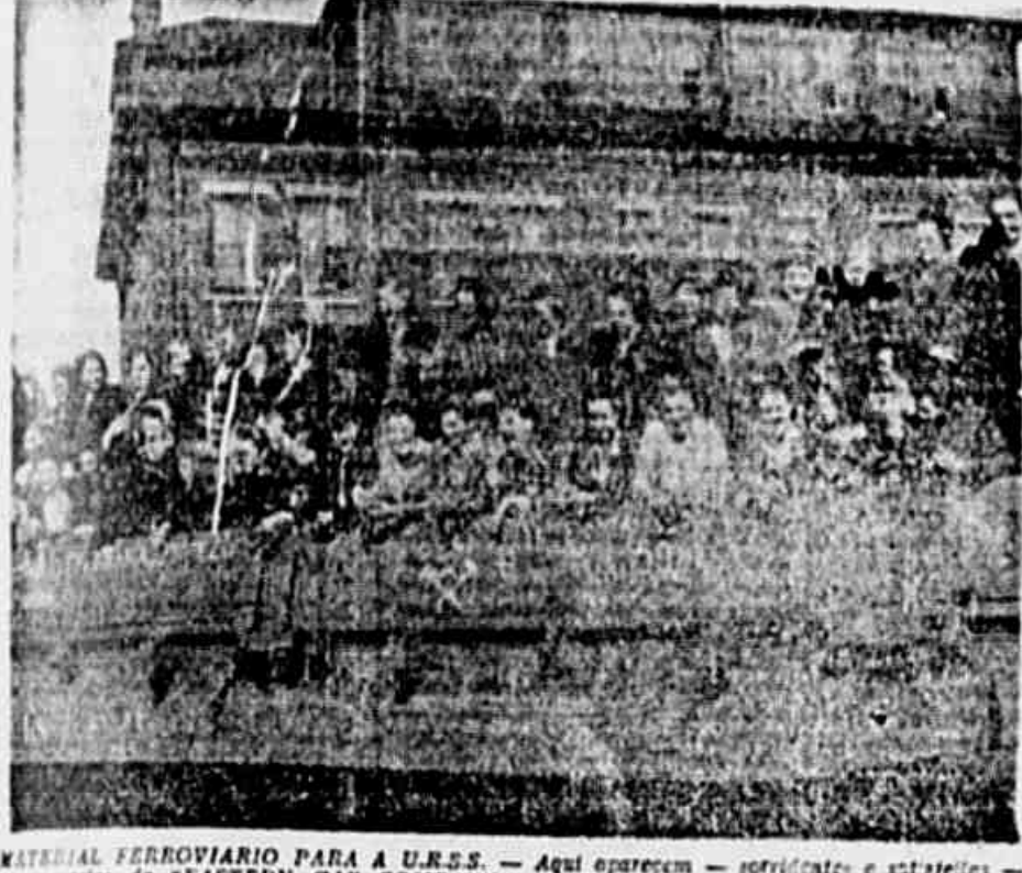
MATERIAL FERROVIÁRIO PARA A U.R.S.S. — Aqui aparecem — soldadores e estaleiros — os operários da "EASTERN CAR COMPANY" de Toulon, nos Estados Unidos sobre um vagão, que eles acabam de construir.