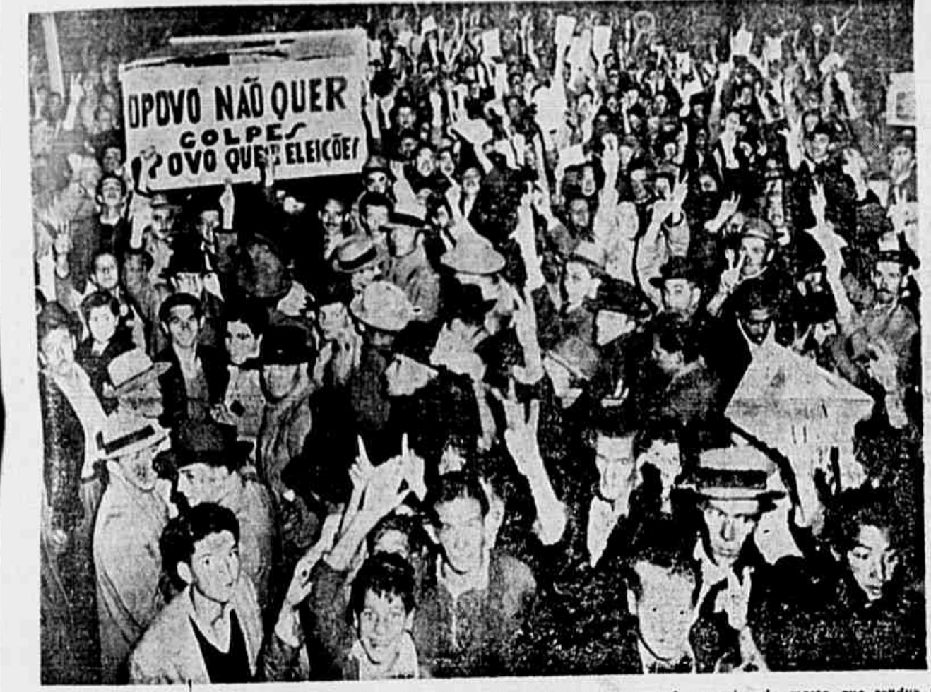
Em dos “meetings” preparatórios da grande reunião de hoje: pode-se observar a expressão, energética da massa que conduz um cartaz de protesto contra as tentativas de golpe e de perturbação da ordem