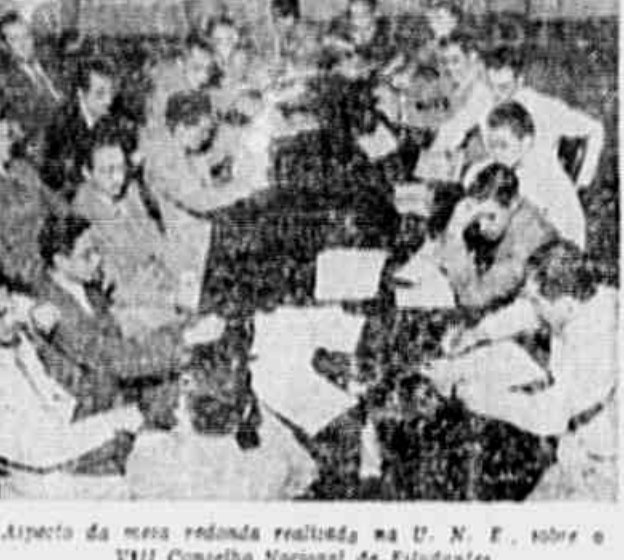
Aspecto da mesa redonda realizada na U. N. E. sobre o VIII Conselho Nacional de Estudantes