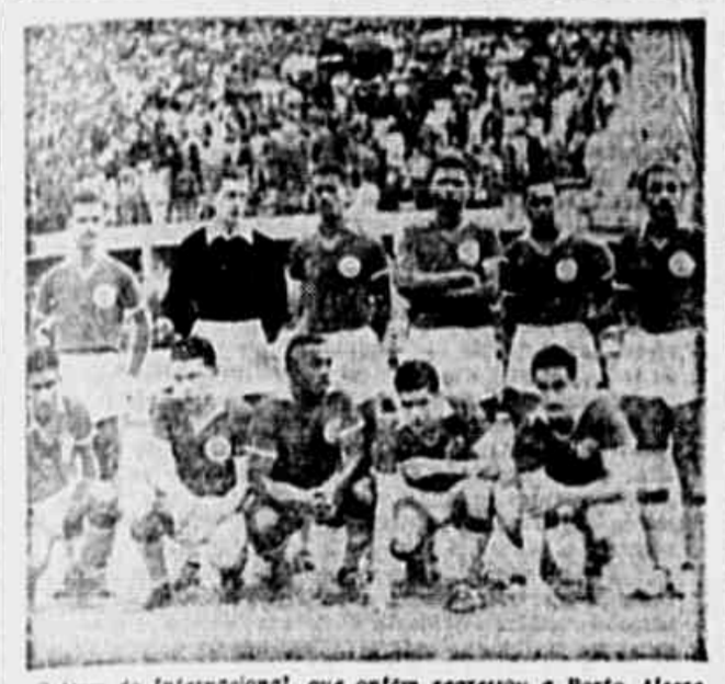
O time do Internacional, que ontem regressou a Porto Alegre

Uma oferta que teria partido do Vasco e o interesse do Botafogo - O obstaculo maior