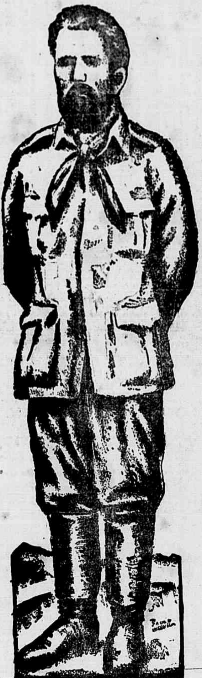
O CAVALEIRO DA ESPERANÇA

COMEÇA HOJE O EMBARQUE DA F. E. B. NA ITALIA Deverão chegar ao Rio a 2 de Agosto