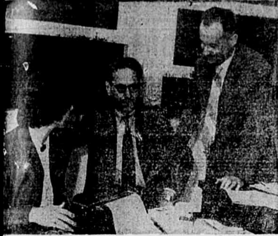
Rodolpho Ghioldi quando nos concedeu sua entrevista

Restam ainda nos ouvidos de todos os brasileiros empenhados na grandeza e progresso de sua pátria as palavras de Luiz Carlos Prestes em seu primeiro encontro com o povo de sua terra. Foram palavras que a História guardará e que o Brasil inteiro ouvirá com atenção e orgulho. Foram palavras que a História guardará e que o Brasil inteiro ouvirá com atenção e orgulho.