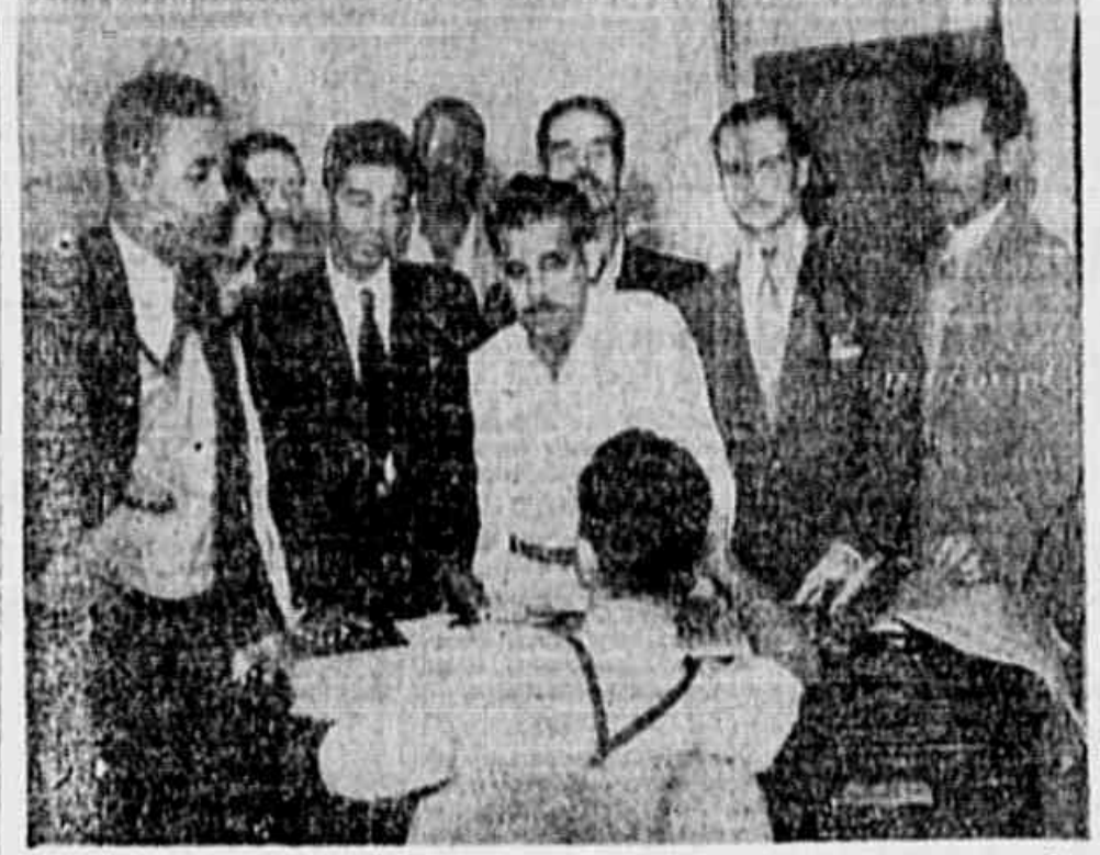
TRIBUNA POPULAR foi visitada ontem por uma comissão de portuários do "Comitê Democrático dos Trabalhadores em Geral"...