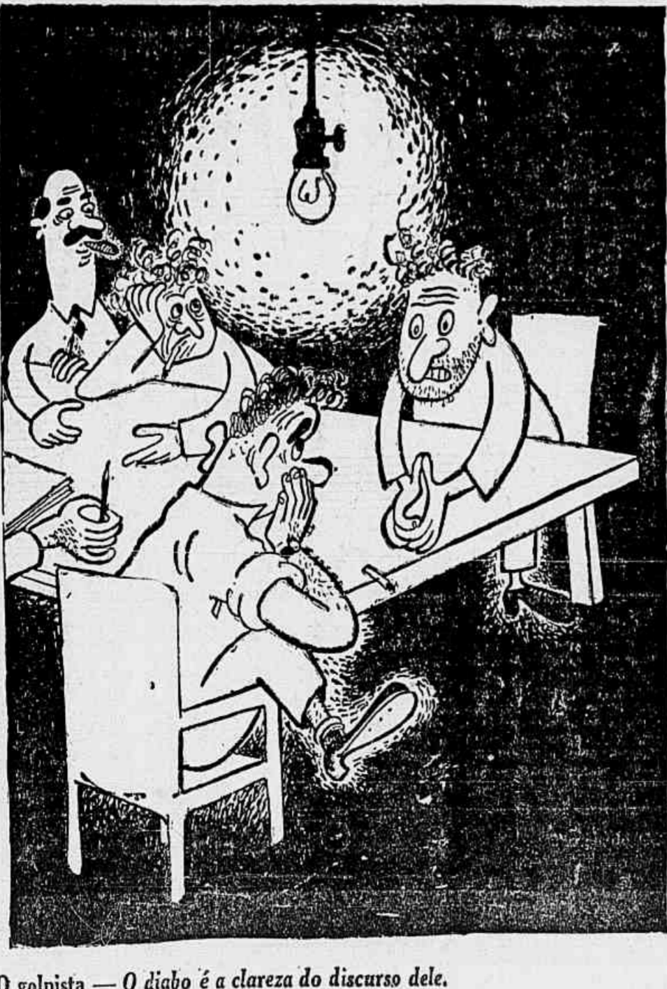
O golpista — O diabo é a clareza do discurso dele.