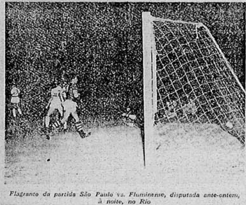
Flagrante da partida São Paulo vs. Fluminense, disputada ante-ontem, à noite, no Rio

Dando nova feição ao certame com que anualmente se iniciam as atividades oficiais do futebol carioca, organizou-se no Rio a tabela para o torneio início que se realizará domingo, incluindo além dos clubes costumeiros mais a equipe do En-