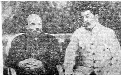
Lenin, ao lado de Stalin, seu fiel discípulo e continuador