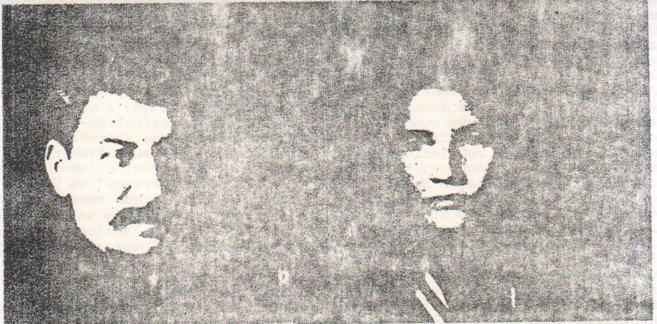
Stálin e uma militante camponesa