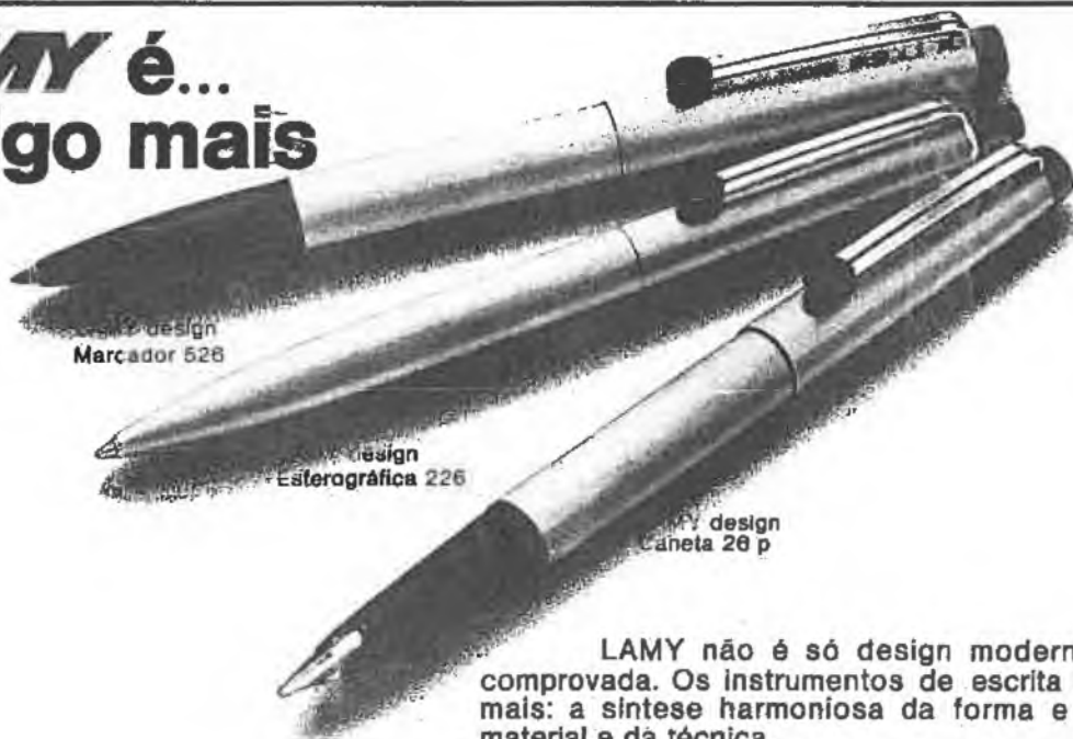
design Marcador 528