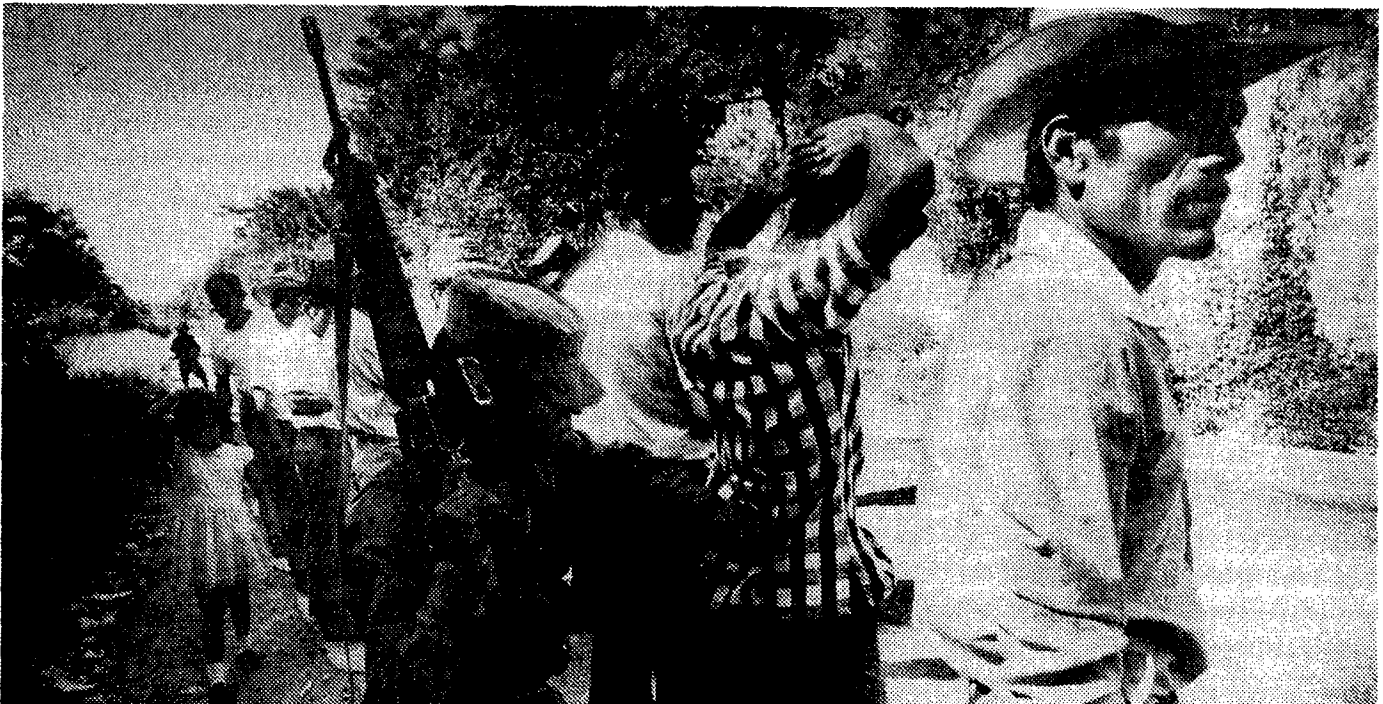
El Salvador. Een wegcontrole van het leger tussen San Salvador en Suchitoto