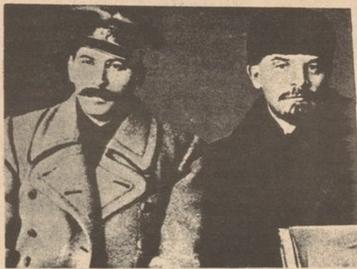
Stalin and Lenin

Han transcurrido 58 años desde la revolución; cuando el gran Lenin y su más avanzado discípulo, José Stalin, dirigieron al partido bolchevique, dando dirección al proletariado y a las masas oprimidas a tomar el poder estatal y así establecer la dictadura del proletariado. Esta, la más grande victoria del proletariado internacional, marcó el principio del fin del orden capitalista en el mundo. Sacudiendo los cimientos del capitalismo, el proletariado ruso se liberó del yugo de la opresión y se dispuso a la