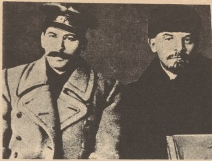
Stalin and Lenin

"It would be naive to wait for a formal majority for the Bolsheviks. No revolution ever waits for that. Kerensky and co. are not waiting either, and are preparing to surrender Petrograd. It is the wretched waverings of the Democratic conference that are bound to exhaust the patience of the workers of Petrograd and Moscow! History will not forgive us if we do not assume power now. There is no apparatus? There is an apparatus, the Soviets and the democratic organizations. The international situation right now on the eve of the conclusion of a separate peace between the British and the Germans is in our favor. To propose peace to the nations right now means to win." (Lenin, Collected Works , Vol. 26, p.21)