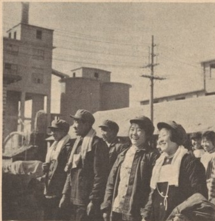
No existe el desempleo en China

Inmediatamente después de la Segunda Guerra Mundial, el establecimiento de la República Popular China fue parte de la creciente marejada de luchas de liberación nacional en Asia, Africa y Americana Latina. También representó una gran pérdida para los imperialistas de los EE.UU. No sólo perdieron la oportunidad de seguir explotando y saqueando los recursos y los mercados de China (600 millones de habitantes en aquel tiempo), pero desde ese momento, China se convirtió en guía, inspiración y apoyo a los pueblos revolucionarios y oprimidos del mundo. Esto ha tomado muchas formas, desde ayuda concreta, a lecciones en estrategia y tácticas, a respaldo político a nivel internacional, a la lucha contra el revisionismo moderno. La revolución China ha sido un ejemplo de cómo las reservas del imperialismo moderno. La revolución China ha sido un ejemplo de cómo las reservas del imperialismo moderno fueron convertidas en reservas de proletariado internacional. (ver "Fundamentos del Leninismo" de Stalin, "Estrategias