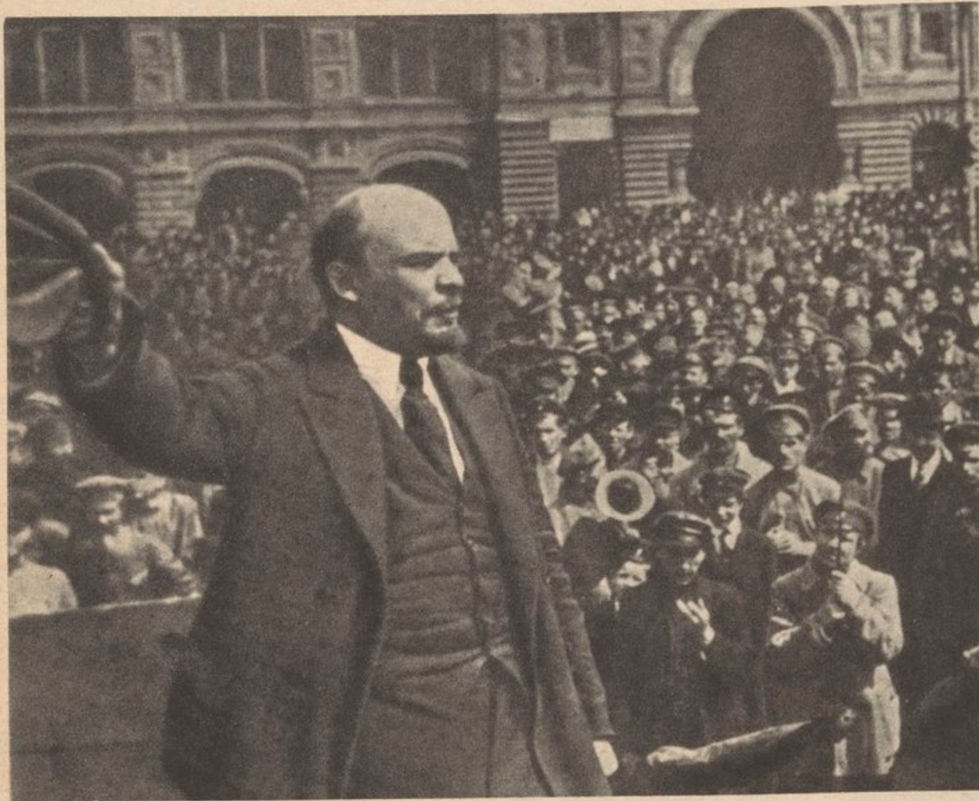
Lenin addresses the Vsevoluch troops on the Red Square, May 25, 1919