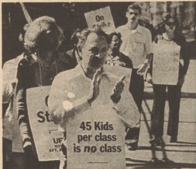
Los maestros de N.Y. en huelga

Debido a esta crisis económica, los maestros, debido del sistema de educación pública, han recibido un fuerte atropello. La burguesía trata de