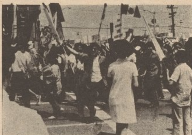
The ATM takes its name from the Chicano Moratorium Against the Vietnam War shown above.

"We are living today in the grip of a deepening imperialist crisis. The multinational U.S. proletariat has responded to this current intensification of the imperialist crisis with a wave of strikes, demonstrations, and rebellions throughout the country. However, as we know, the proletariat still lacks its general staff-- its Bolshevik Party-- and so it has been confined to spontaneous struggles against the