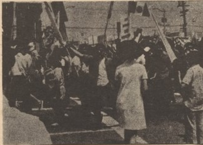
MORATORIO CHICANO CONTRA LA GUERRA agosto 29, 1970

"Vivimos hoy en una crisis imperialista que se empeora cada día mas. El proletariado multinacional de los EE.UU., ha respondido a la actual intensificación de esta crisis con una ola de huelgas, manifestaciones y rebeliones a través de todo el país. Sin embargo, como todos sabemos, el proletariado