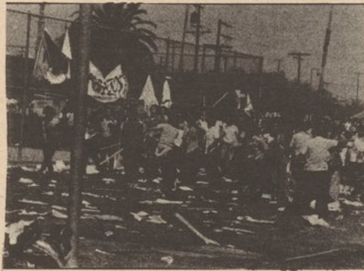
Chicano Moratorium against the war August 29, 1970.

"Comrades, on nearly every question regarding the party, RU's line either openly or covertly refutes and revises the teachings of Lenin on the party. RU's line tails spontaneity, is economist, belittles