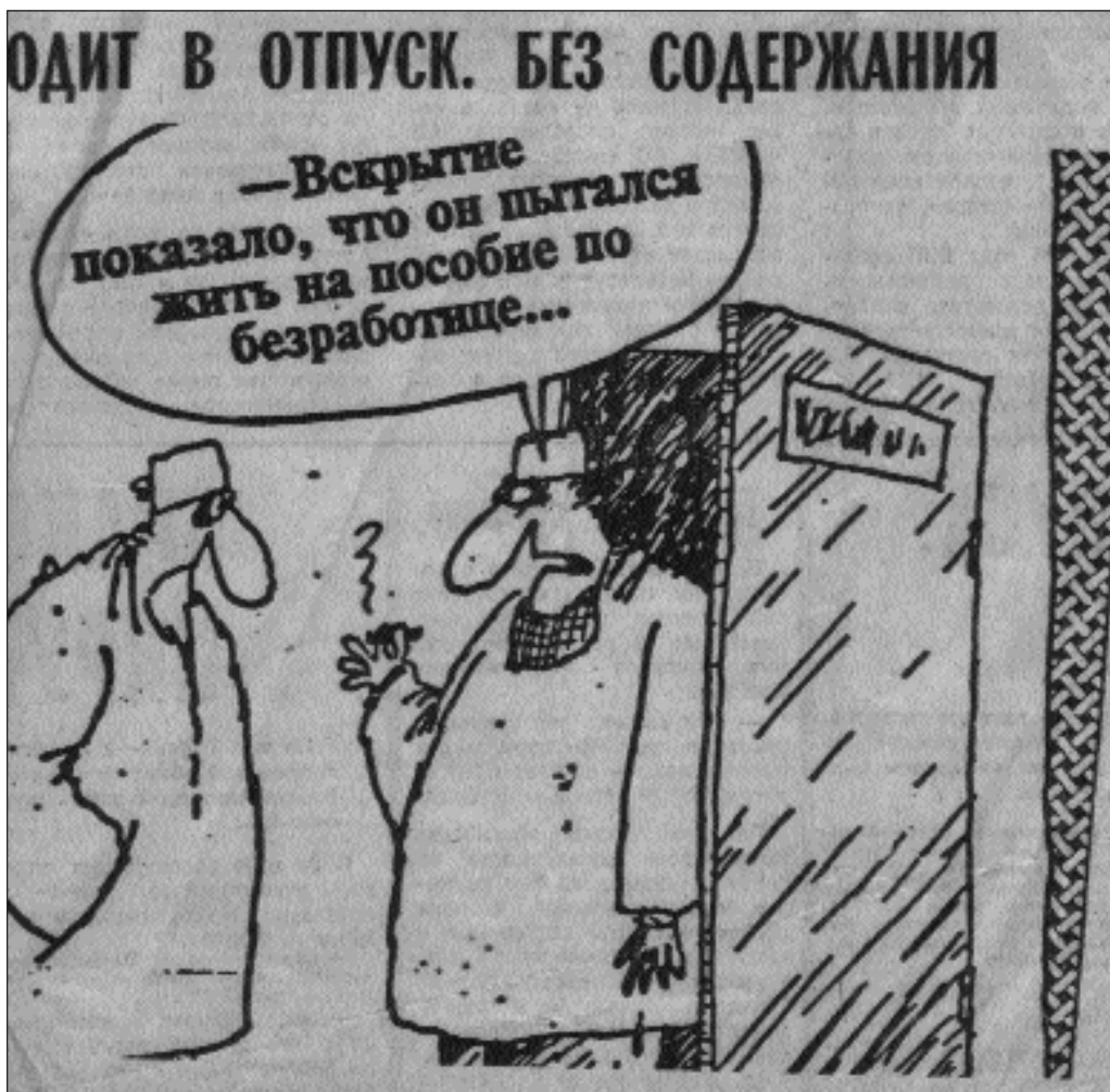
“L'autopsie a montré qu'il a tenté de vivre avec son allocation de chômage...”