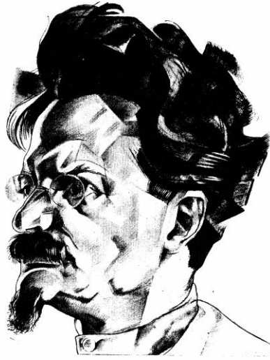
TROTSKY