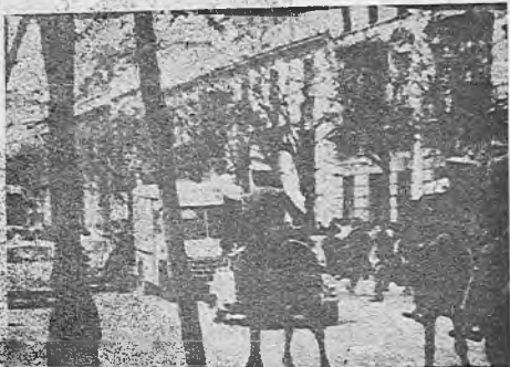
El Gobierno Civil carga sobre una concentración obrera

En las últimas semanas, centenares de miles de explotados españoles le han dado un nuevo y formidable impulso a su lucha.