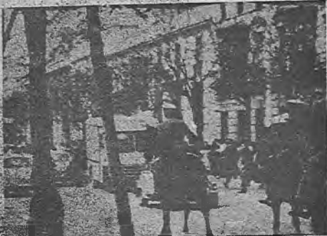
Quilates. Civil carga sobre una concentración obrera

En las últimas semanas, centenares de explotados españoles levantan un nuevo y formidable impulso obrero.