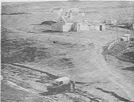
Stanley, capital de las Malvinas

Al decir de algunos voceros capitalistas el valor estratégico de las islas Malvinas había dejado de tener importancia para Gran Bretaña. Durante mucho tiempo para el entonces pujante colonialismo inglés las islas constituyeron el principal puerto de reabastecimiento carbenero del Atlántico Sur, escala obligada de los buques balleneros y punto estratégico vital por su posición cercana al estrecho de Magallanes. Actualmente la producción ballenera mundial se encuentra en extinción, y particularmente la posición privilegiada de las islas para ejercer el control de la navegación interoceánica, había perdido significación a partir de 1912 con la inauguración del Canal de Panamá.