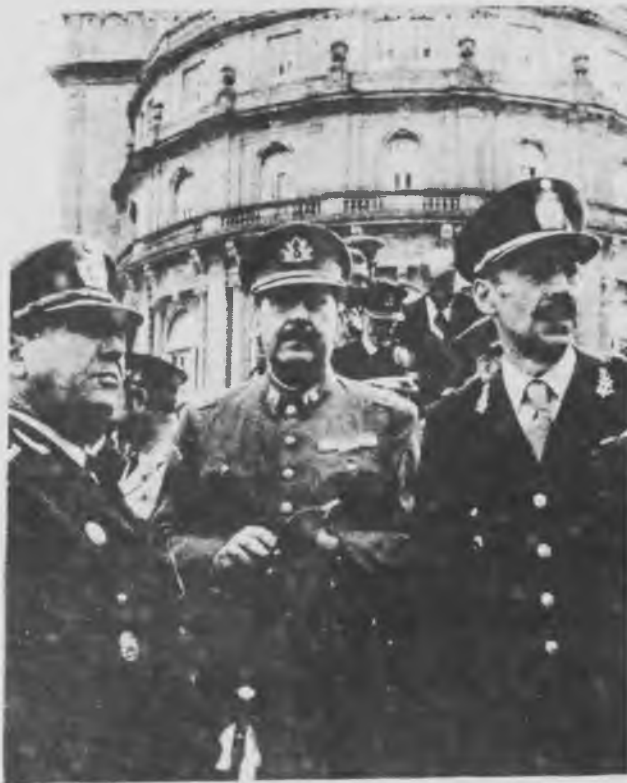
El General Videla en la XI Reunión de Ejércitos

La anterior Conferencia de Ejércitos Americanos tuvo lugar en 1973 en Caracas. La emergencia de una situación revolucionaria en Chile, las extraordinarias movilizaciones de masas en nuestro