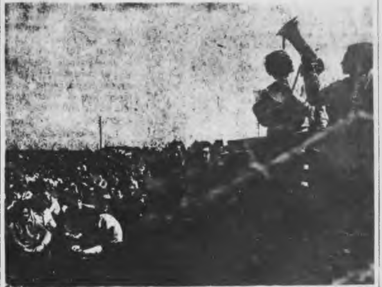
Movilización de Mercedes Benz

preparemos la huelga general en defensa de los convenios y el reajuste salarial