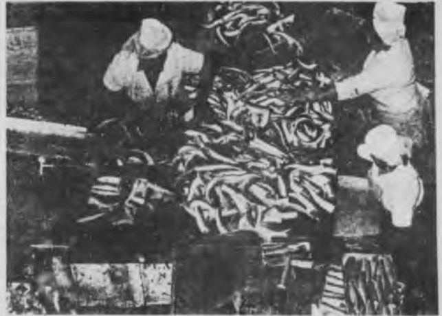
Los trabajadores del Pescado pararon del 4 al 15 de agosto por el cumplimiento del convenio

y el sabotaje total a las luchas obreras por parte de la dirección de la CGT Regional, que está enrolada en la extrema derecha del verticalismo (tiene públicas vinculaciones con la CNU, y con las autoridades universitarias que son de ALN) son la causa principal de la falta de una respuesta unificada a la ofensiva patronal, y al constante ataque a las libertades democráticas.