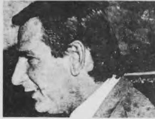
Calabró postula una salida patronal con los partidos opositores y los militares "prescindentes".

En este proceso, Calabró se vio obligado a denunciar una cuestión central para la clase trabajadora. "En la provincia de Buenos Aires está demostrado que cada día se reducen los horarios", "una desocupación disimulada". "La crisis económica se ha agudizado porque no ha habido medidas de fomento para paralizar ese proceso que vie-