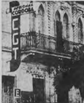
Hay que unificar al movimiento obrero cordobés, por un Congreso de Bases de la CGT