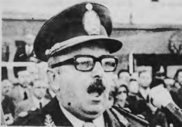
General Numa Laplane

La conducta debió ser, por el contrario, montar una amplia campaña de agitación política para mostrar la futilidad del terrorismo derechista y lanzar —también— como tarea de agitación y organización la consigna de puñetes obreros de autodefensa contra el terrorismo derechista.