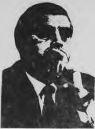
(Viene de la pág. 5)

visas". Es que una cesación de pagos de estas economías semicoloniales puede repetir, en una escala más alta, la cadena de quiebras bancarias que golpearon a Estados Unidos y Europa durante el año pasado.