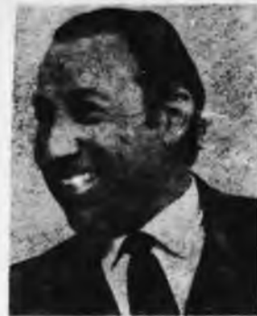
RICARDO OBREGÓN CANO

Estamos ante una ofensiva de vasto alcance, que viene siendo preparada desde hace algunos meses por el gran capital. El gran capital (automotriz e industrial) viene desarrollando una ofensiva contra la gobernación, en la medida en que ésta ha beneficiado a los sectores medianos del capital agrario y adoptó ciertas medidas de magógicas ante las masas y la Juventud Peronista. Ahora, esta ofensiva se remata con la intervención directa de Perón que en su último discurso por radio y televisión hizo una defensa virulenta del pacto social y atacó a la gobernación cordobesa.