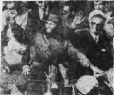
FIDEL CASTRO Y SALVADOR ALLENDE

13) El centrismo, es decir la pretendida izquierda de la UP, formada por las fracciones del PS, el MAPU y el MIR, han jugado el rol de cobertura de izquierda del Frente Popular. El castrismo a puesto todo su peso político y todos sus medios materiales en apoyo de estas organizaciones, jugando sus fuerzas para defender a Allende y la Unidad Popular frente a las masas, permitiéndole jugar su rol contrarrevolucionario hasta último momento.