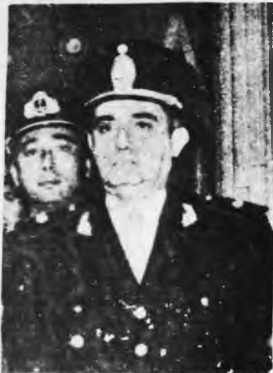
Gral. de Brigada Cáceres.

■ Durante la última semana el gobierno dió una nueva vuelta de tuerca a los mecanismos de represión, tendientes a asegurar, según palabras del propio Perón, la desaparición de "algunas excrecencias políticas que han salido fuera de las órbitas del movimiento político legal y organizado". Los métodos utilizados consisten en la Reforma del Código Penal, la Firma del Acta de Seguridad Nacional, la designación de militares lanussistas comprometidos con la represión de la dictadura en cargos importantes del Ejército, y la extensión del ámbito de la Justicia Federal a las provincias. El objetivo es dotar al gobierno de una estructura legal capaz de enfrentar cualquier movimiento político que no respete las "reglas del juego", es decir el Pacto Social, el po-