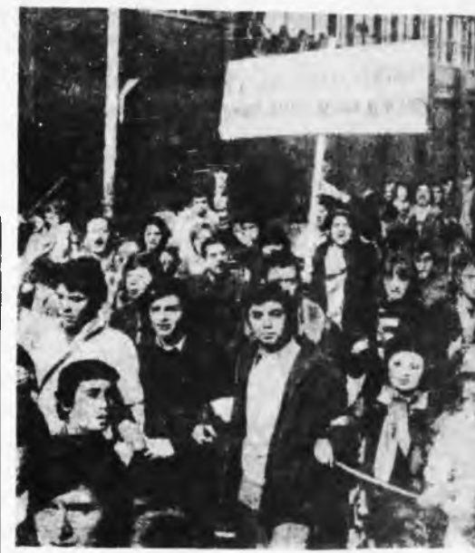
la revolución proletaria.

El Buró Internacional afirma que la experiencia chilena demuestra que el frente popular no tiene jamás un carácter "progresista", cualquiera sea el país donde se desarrolle. El frente popular representa, junto al fascismo, el último recurso del imperialismo contra