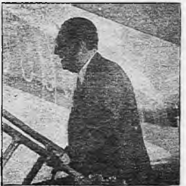
sa tregua, Perón montó su acuerdo político.