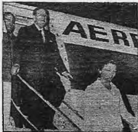
mitió decir que la candidatura de Perón era "una decisión del pueblo y Perón hará lo que el pueblo quiere".

En estos términos, la renuncia se mantiene en la línea que hemos señalado hasta aquí: evitar el más mínimo motivo para movilizaciones ante la proscripción de su candidatura. La mención que hace Perón de la "dictadura militar" es puramente declarativa. En realidad, el renunciamiento equivale a hacer potable el frente burgués encabezado por el justicialismo para permitir una salida concertada con el conjunto de la clase burguesa, el ejército, la iglesia y el imperialismo: La insistencia hasta último momento en la candidatura hubiera significado un factor de enfrentamiento político y,