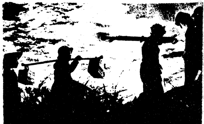
GUERRILLERAS DE VIETNAM TRASPORTAN EQUIPOS ANT AEREOS