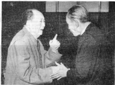
El Presidente Mao Tse-tung entretiene a uno de los líderes indochinos.