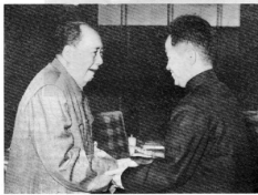
El Presidente Mao Tse-tung entretiene a uno de los líderes indochinos.