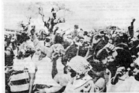
El pueblo de Zimbabue celebra jubilosamente el nacimiento de su libertad.

Inspirado entre las fuerzas leales y resuelto a ser engañado, el pueblo de Zimbabue, que