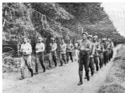
La marcha de los guerrillas de Zimbabue.

caracteron problemas de interés común y adoptaron medidas importantes evolucionando. La conferencia significó la orientación general de combates al imperialismo, al colonialismo, al racismo, al sionismo y al hegemonismo de las superpotencias. Se adhirió a la línea de compatibilizar la liberación nacional a través de la lucha, sobre todo de la lucha armada, y puso en pleno juego el espíritu de unidad combativa de África. La conferencia fue exitosa y fructífera.