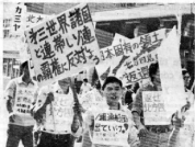
Manifestantes japoneses en Hokkaido salían de sus embarcaciones con pancartas que decían cosas como "Oposición a la anexión del territorio soviético" y "Anexión con los países involucrados para combatir el imperialismo soviético".

del pueblo japonés contra el imperialismo soviético. En el movimiento por recuperar el territorio soviético, el pueblo japonés ha expuesto de continuo los siguientes motivos soviéticos de continuar un seduciente sistema de seguridad colectiva de Asia. En un folleto publicado en marzo pasado, la Asociación para la Investigación del Problema Norteamericano tituló "La Unión Soviética creó una política de hegemonía con Estados Unidos en escala global, igual que el Mediterráneo y el Índico, el Pacífico es objeto de sus tentativas. Por eso, la URSS está llevando a cabo una política de garrote y amenaza hacia el Japón en un esfuerzo de someterlo a su voluntad". Otavillas distribuidas en febrero pasado por estudiantes de Tokyo decían: "El propósito de la URSS de incluir al Japón en su sistema de seguridad colectiva de Asia" es colocar el país bajo su control y continuar ocupando nuestro territorio soviético".