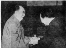
El Presidente Mao Tse-tung estrecha la mano a Samdech Norodom Sihanouk.

la victoria definitiva en su guerra de liberación nacional en un lapso de tiempo de poco más de cinco años. Cuando Samdech Sihanouk agradeció la ayuda del pueblo chino al pueblo camboyanos, el Presidente Mao señaló: No es el pueblo chino quien ha prestado la que se llama ayuda al pueblo camboyanos, sino que es el pueblo camboyanos quien ha ayudado al pueblo chino.