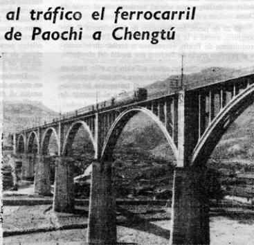
Un tren eléctrico de la línea Paochi-Chengtú.

Esta obra es la cristalización de una gran cooperación socialista. Pekín, Tientsín y Jopei movilizaron ampliamente a las masas para que participaran en la construcción. Más de 240 fábricas y minas del país trabajaron para la manufactura de los tubos de acero, motores eléctricos, bombas de aceite, transformadores y otros equipos principales y accesorios necesarios para la obra.