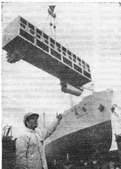
Un vistazo del Astillero Chiangnan en Shanghai.

La técnica de purificación ambiental consiste en adoptar diversas medidas de filtración para limpiar de polvo el aire en las fábricas y pro-