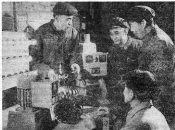
Ensayando pequeños turbogeneradores hidroeléctricos.

UNA planta en la ciudad de Jarbín, nordeste de China, ha fabricado un turbogenerador hidroeléctrico de 300.000 kw., el mayor de su género en China para la gigantesca Central Hidroeléctrica Lúchiasia ubicada en el curso superior del río Amarillo, que empezó a funcionar hace poco. Al mismo tiempo, otras fábricas han producido gran número de pequeños turbogeneradores hidroeléctricos para equipar