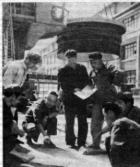
Un equipo proyectista de "integración triple" está trabajando en el sitio de construcción.

En el curso de hacer proyectos, los proyectistas profesionales se integran con los proyectistas aficionados obreros y campesinos, formando un poderoso contingente de proyectistas de nuevo tipo que está desempeñando un papel cada vez mayor en la causa de la construcción socialista de China.