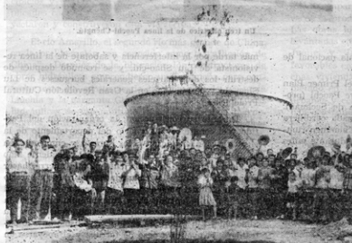
Obreros y empleados junto con sus familias aclaman la llegada del petróleo crudo de Taching a Pekín por el oleoducto.

Los obreros trabajaron con esmero. Se soldaron los tubos muy cuidadosamente. Las decenas de miles de juntas soldadas correspondieron todas a los requerimientos cualitativos al ser sometidas a los exámenes y pruebas de presión,