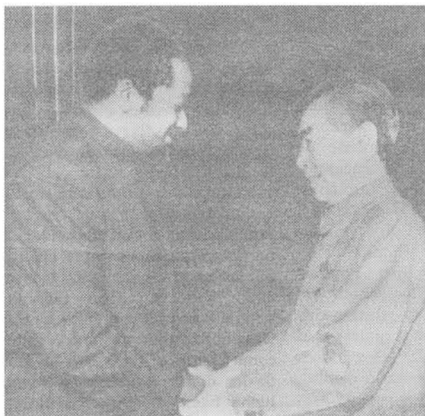
El Primer Ministro Chou En-lai se entrevista con el Primer Ministro Burnham.