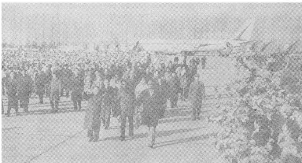
El Primer Ministro Burnham recibe una calurosa bienvenida en el aeropuerto de Pekín.

tó en un hospital con el Primer Ministro Burnham y con H.O. Jack, minis-