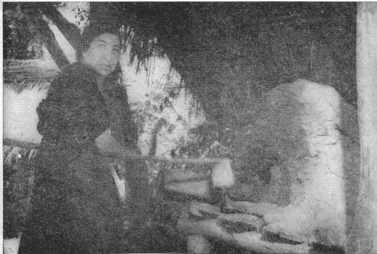
La mujer campesina está al margen de un trabajo realizado en condiciones higiénicas