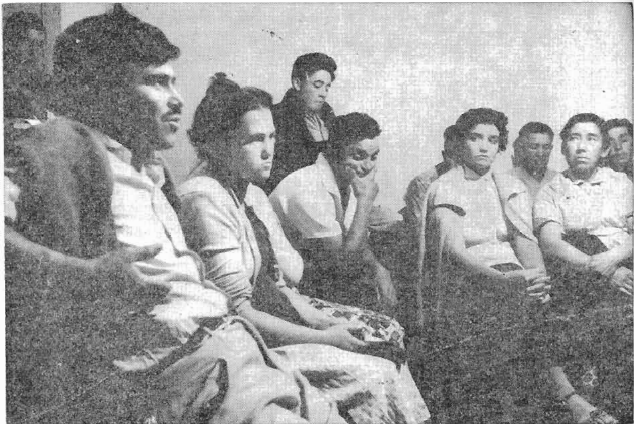
El campesino chileno delibera y participa en los objetivos de la Reforma Agraria