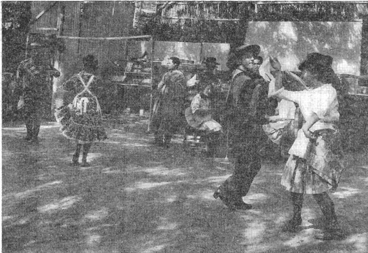
La alegría del campesino será el reflejo real de los beneficios de la Reforma Agraria