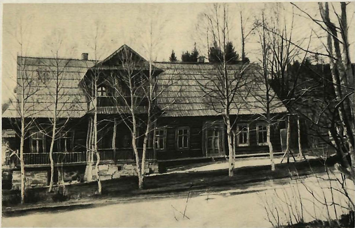
La casa en Poronin en la que vivió V. I. Lenin en el verano de 1913 y 1914