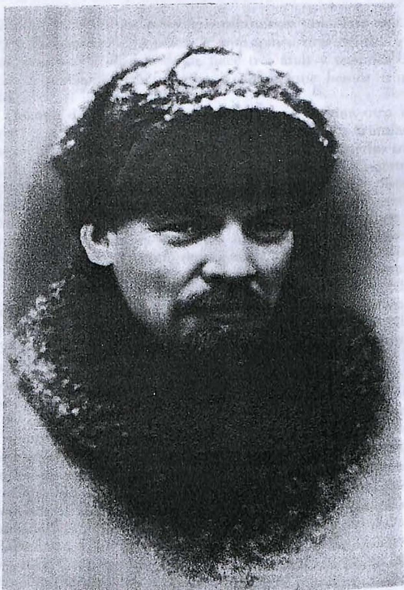
V. I. LENIN