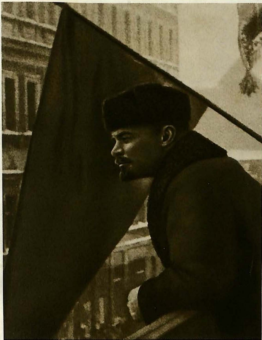
V. I. LENIN 1919