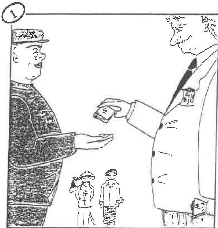
1. 世界銀行貸款予 中國政府