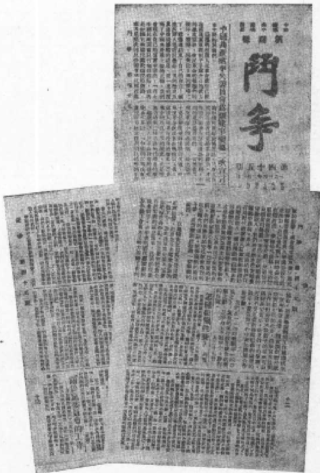
1934年2月2—23日中国共产党苏区中央局《斗争》报 第45—48期所载列宁《怎样组织竞赛?》一文的中译文