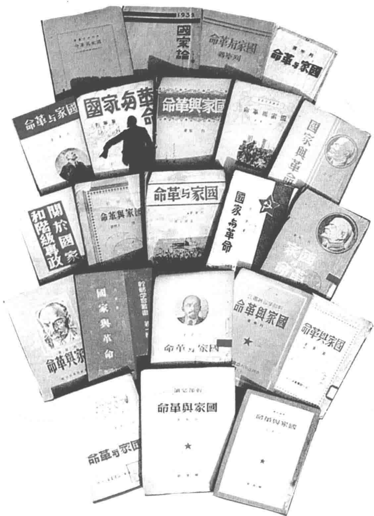
1929—1949年我国出版的 列宁《国家与革命》一书的部分版本