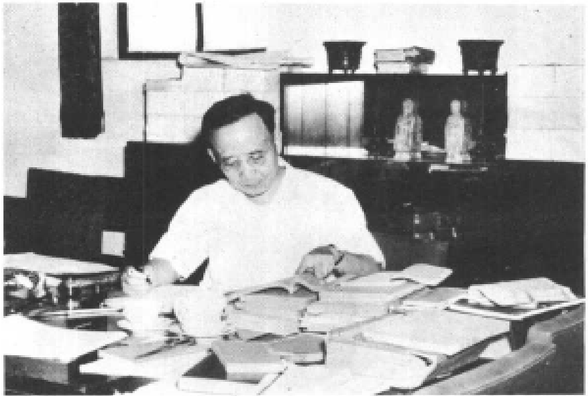
郭沫若在写作(一九五四年)。