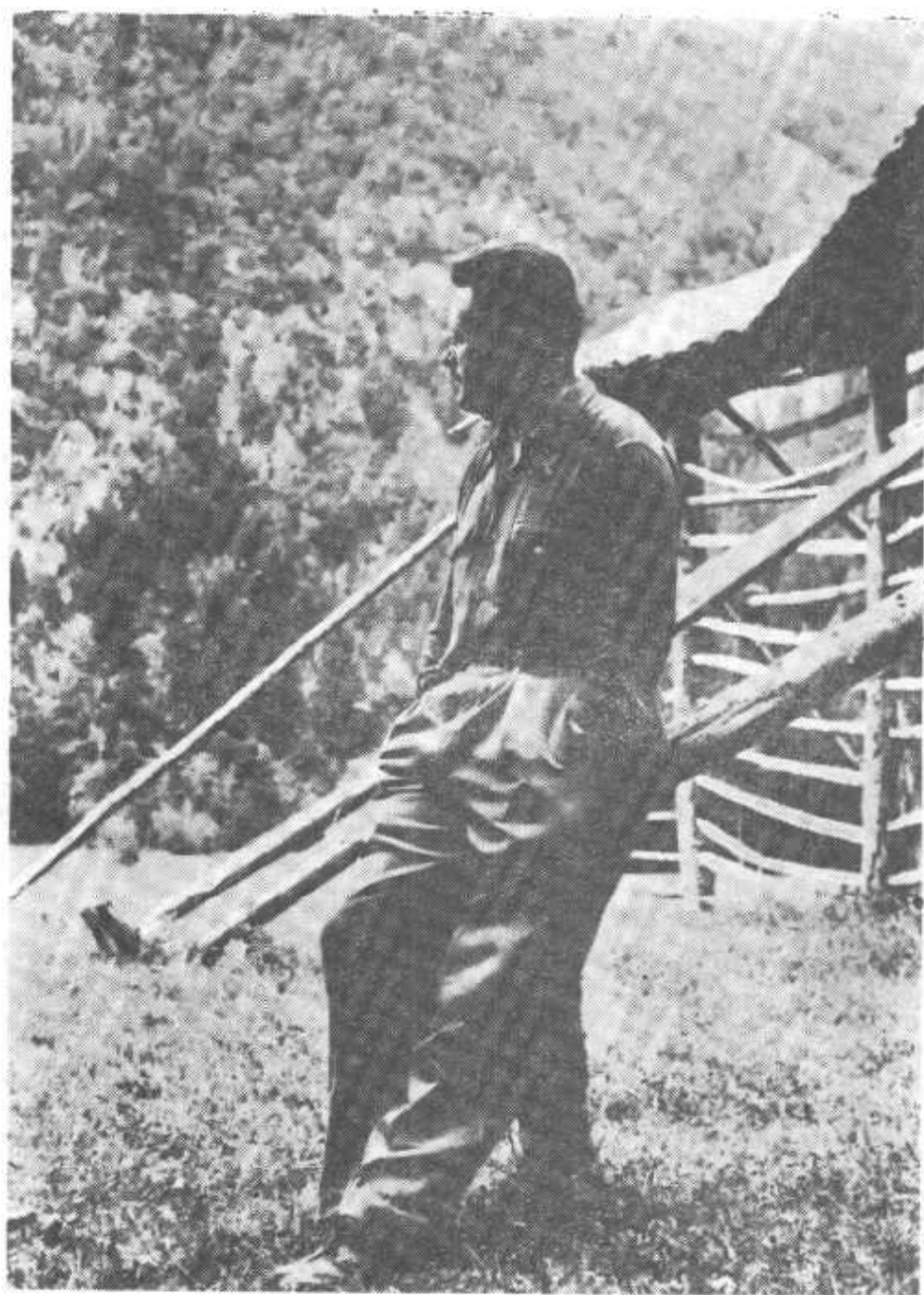
1944年摄于科切夫罗格