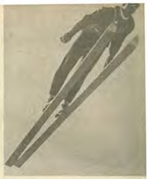
Подътът на Манфред Волф (ГДР) по време на рекордния му скок от 165 м

След победите си в Шръбске плесо студентът по педагогика в град Горки Гари