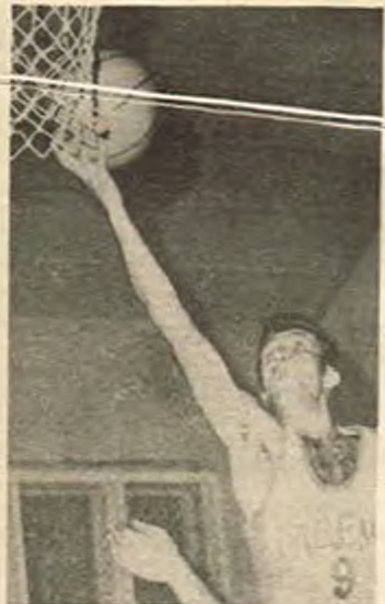
На дневен ред са сре- щите реванш от осми- нафиналите на евро- пейските клубни бас- кетболни турнири.