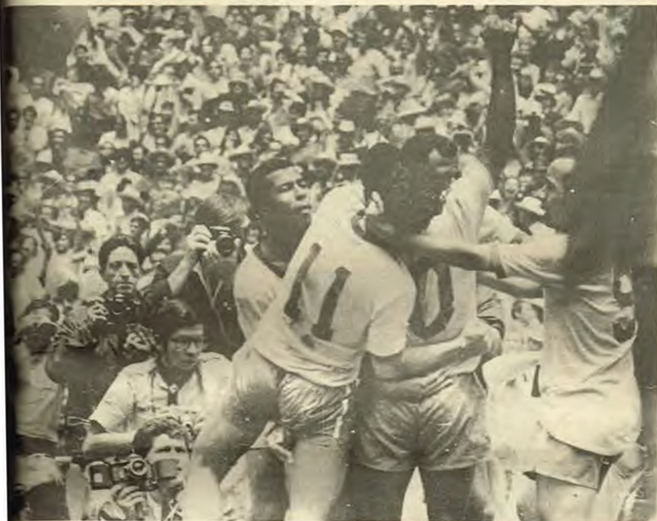
Това е в прегръдките на ликовците си другари. Под ръководството на треньора Загало бразилският национален отбор завинаги отнася купата „Жуа Риме“.