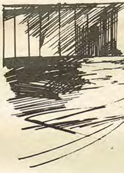
Илюстрация от Николай БУЖКОВ

„Сокол“. Между познавачите се разгоря бесен спор, посипаха се взаимни оскърбления и работата завърши със сбиване. Новината се потвърди едва след три дни: посред блз ден, пред очите на всички, Дузанов и Майка излязоха от къщата и взеха такси. След това Альоша ги виждаше често, мъчеше го и любовитство, и ревност, и стеснение, и uznetyavayushcheto съзнание за собственото му нищожество. Това бяха очевидно първите мъки на несполелената любов.