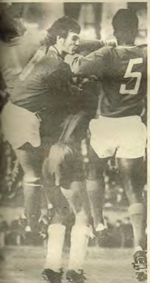
...Французи срещу един българин... Понякога и това помага!