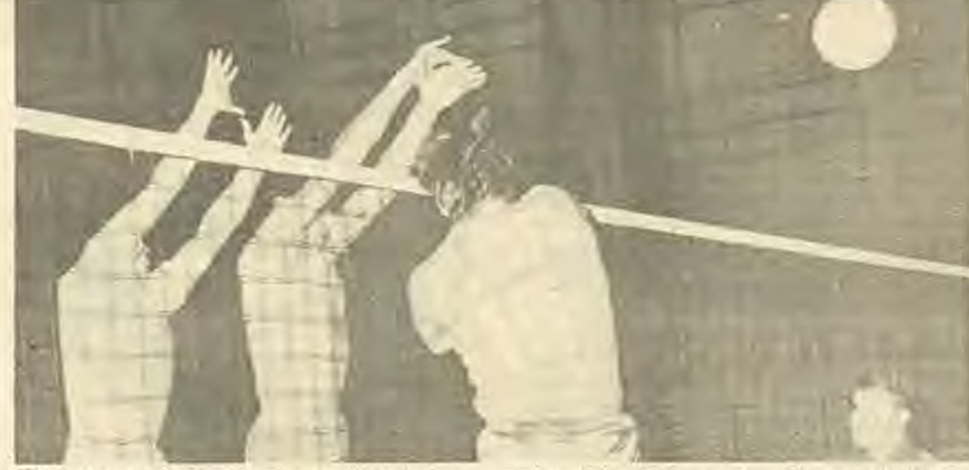
Една от осемнадесетте точки, постигнати от финландския шампион, долетял от Палечния север, където вече настъпва полумрачната нощ. . .

И трите гейма завършиха с по 15:6 и навярно никой не би се заел сериозно да прави изводи от показаното на терена. Финландците любезно, с един стопроцентов аматьорски дух посрещнаха ударите на противника и не се съкрушаваха дори и от комичните ситуации, в които изпадаха. Така например веднъж бяха сервисирани почти от средата на игрището — момчето просто се беше заблудило. После треньорът им вкара в игра един истински фински първо-