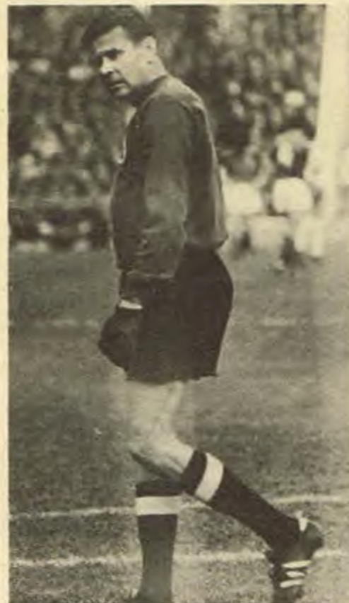
Една от последните снимки на Лев Яшин на футбален терен... Направена е на срещата „Динамо“ - СФ отбор специално за „Старт“. Вратарят изглеждаше наистина малка, когато престопаваше незабравимият Георги Найденов.

Тези данни на съветския статистик К. Есенин едва ли се нуждаят от коментар.