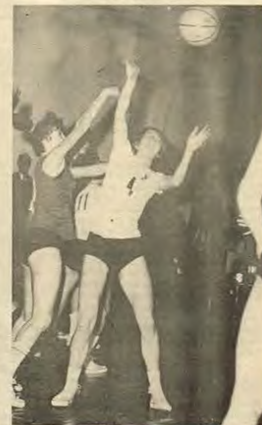
Славистите (в бели фланелки) изненадаха с играта си столичния „Академик“, а с голямата си победа – зрителите в зала „Сливница“.