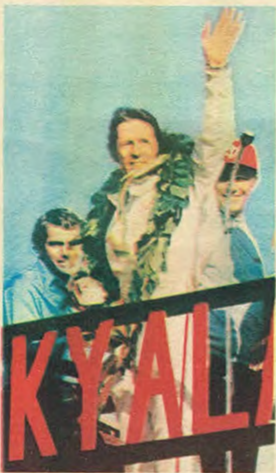
Джеки Стюарт - световен шампион по автомобилите за 1971 г., с лавровия венец на победата. Долу: Така изглежда състезателната кола „формула 1“, четете на стр.11)