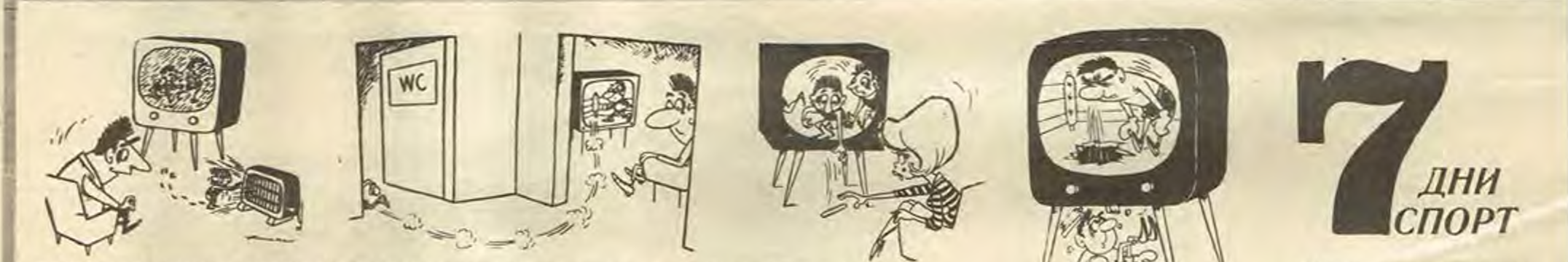
ТЕЛЕВИЗИОННИТЕ СПОРТНИ ПРЕДАВАНИЯ ПРЕЗ ОЧИТЕ НА КАРИКАТУРИСТА

Аржентинският гротмайстор Найгорф, шегувайки се, преджил да се организира мач на „срине“ гротмайстори Ботви (СССР), Найгорф (Аржентина), Шалберг (Швеция), Лилиен (СССР) и Флор (СССР) прои „младите“ Тал (СССР), Фиш (САЩ), Петросян (СССР), Лбарди (САЩ) и Гелер (СССР). Като научил за това, Фишер казал: „Защо мач? Аз ще им сеяс на едновременна игра.“