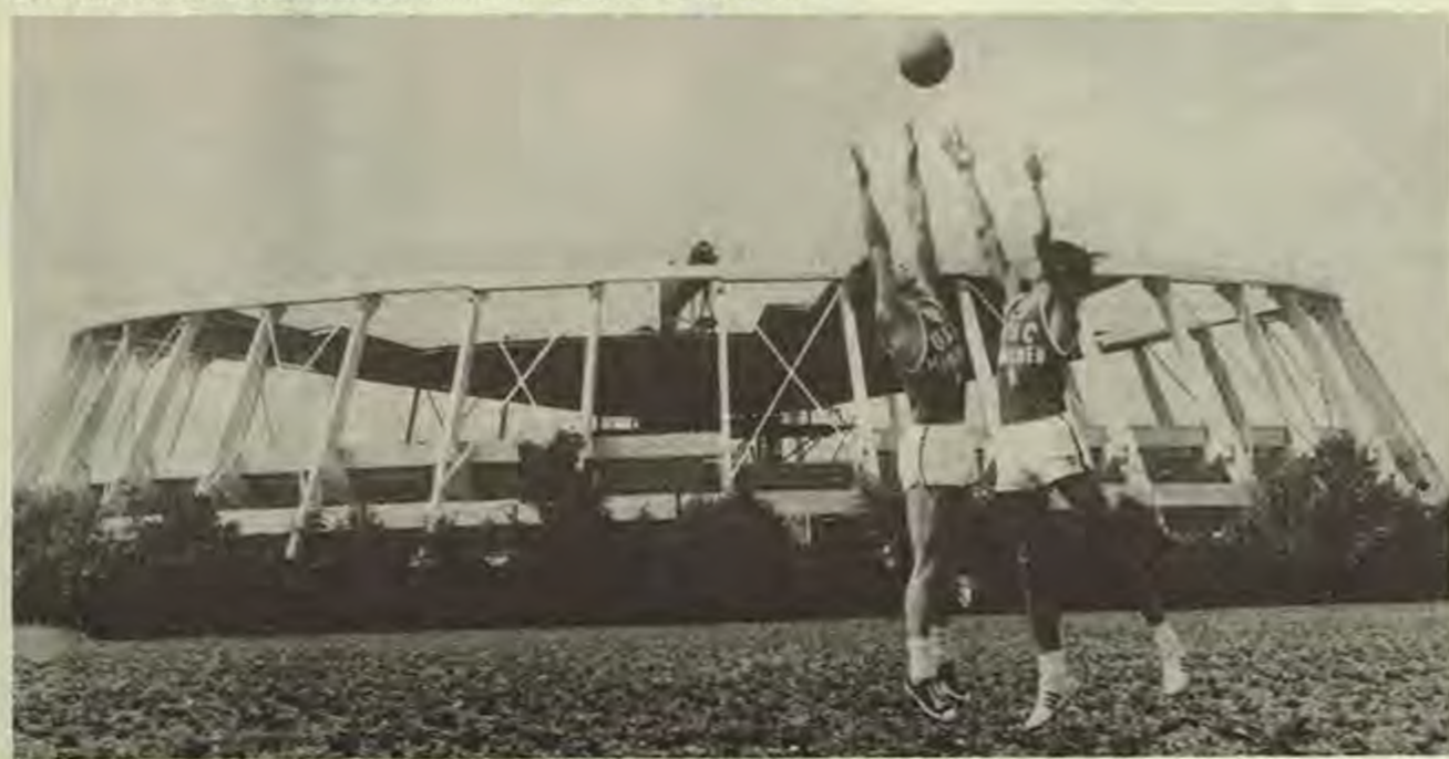
Баскетболната зала в Мюнхен, която побира 6360 зрители.