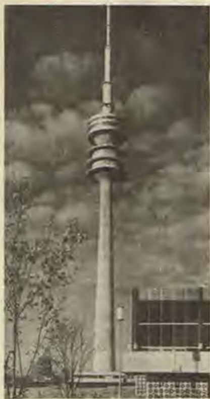
Олимпийската кула в Мюнхен - най-високата в ГФР (290 м), от която ще се препредават в целия свят по радиото и телевизията олимпийските състезания.

„Усилията за усъвършенстване дейността на БСФС трябва да измерят най-пълно и конкретен израз... в образователната подготовка на българските спортисти, за да бъдат те в състояние да щурмуват европейските и световните рекорди, достойно да представят нашата страна на олимпиадата в Мюнхен през 1972 г.“