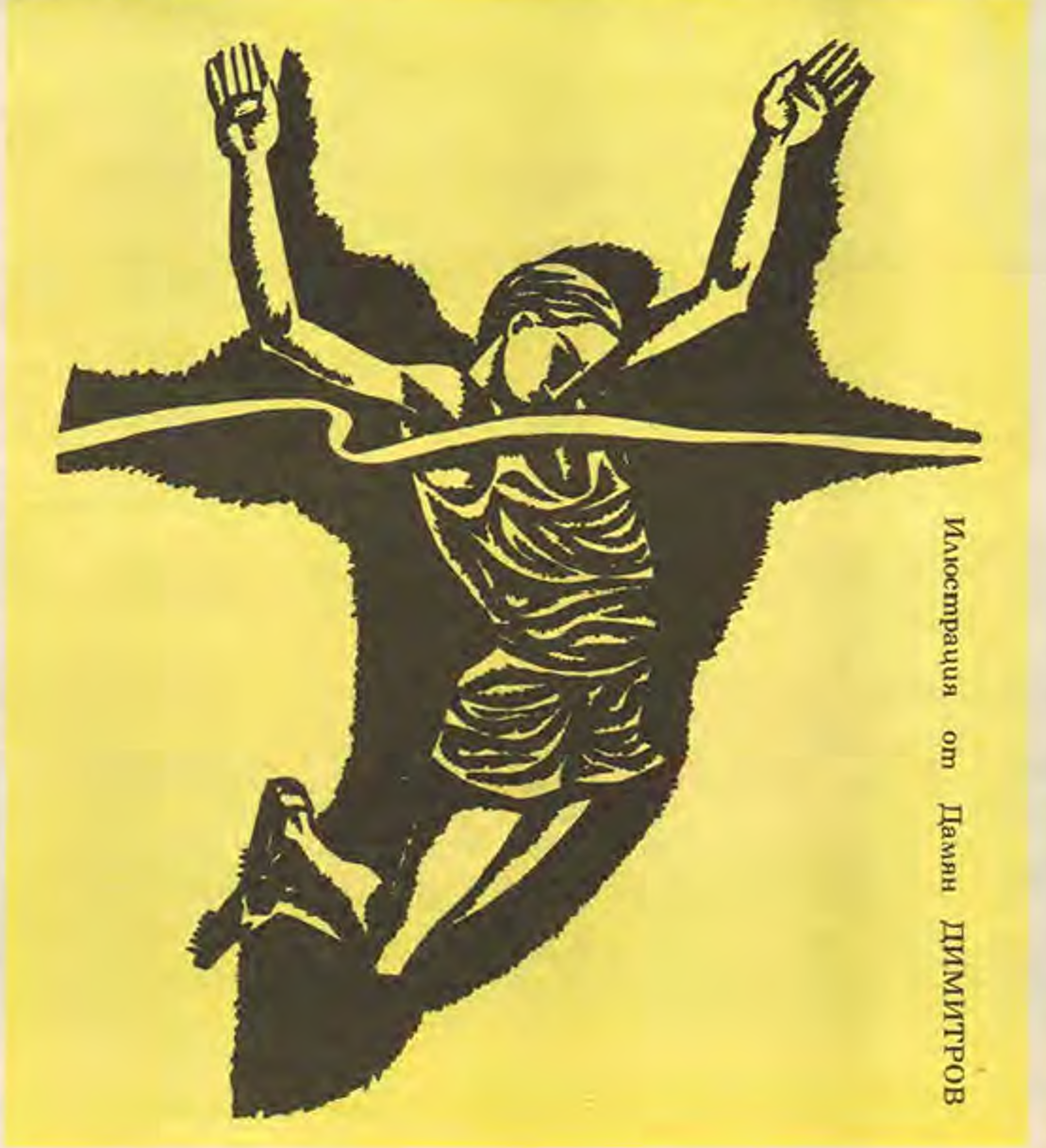
Илюстрация от Дамин ДИМИТРОВ

Не можеше да събере мислите си: прече- ше му силната болка в рамото. Той беше спечелен, беше спечелен сре- щу Дим Димич, но най-важното, най- трудното е напред. И е почти невъзмож- но да го направи, както и да подобри световния рекорд. Невъзможно ли? Невъзможно... Не... „Всичко ще бъде красиво.“