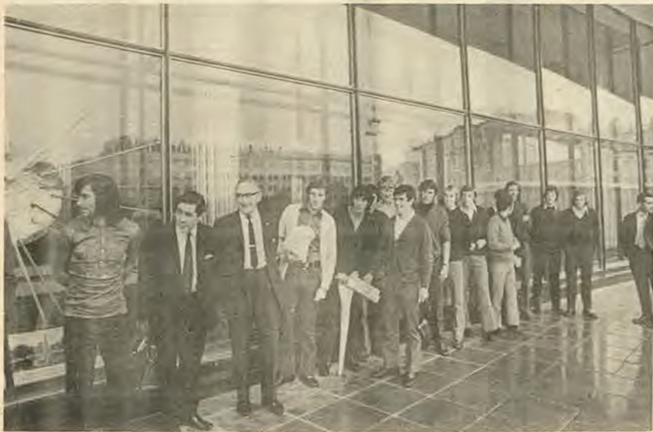
Северноирландският отбор начело с Джордж Бест в плен на московския гъжд под страхата на хотел „Россия“.