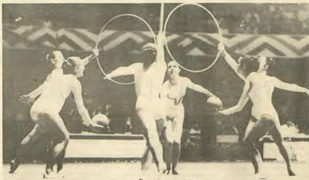
Нашите ансамблистки в зала „Суидаг депортива“ по време на голямата борба...