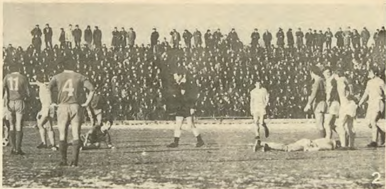
Затова на стадиона в Плевен остана твърде малко време за истински футбол...

1. Ето своеобразното възнаграждение, което е приятния момент, когато голмайсторът атакуван без топката - атакуван от своите плевенски съперници... 2. Ето особено не-приятния момент, когато голмайсторът атакуван без топката - атакуван от своите плевенски съперници... 3. Ето и продължителния спор на плевенските спартаковци със съдията и неговия помощник след гола. 4. И затова за устремни пробиви (като това нападение на Жеков) имаше твърде малко време.